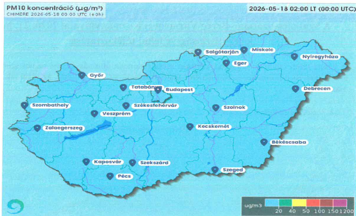
Országos PM 10 koncentráció jelenlegi helyzete forrás – www.legszenyezettseg.met.hu