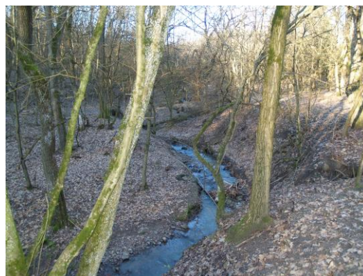
2. ábra.: Meszes-patak