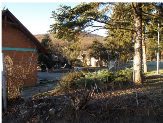
1. ábra.: Meszes-major