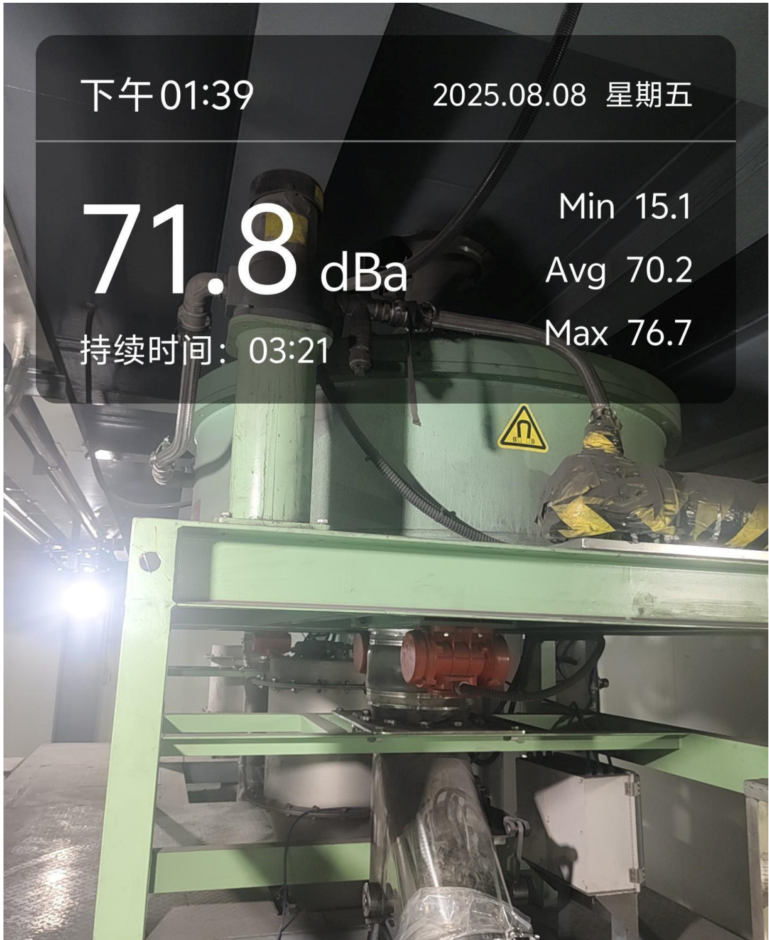
Electromagnetic iron remover