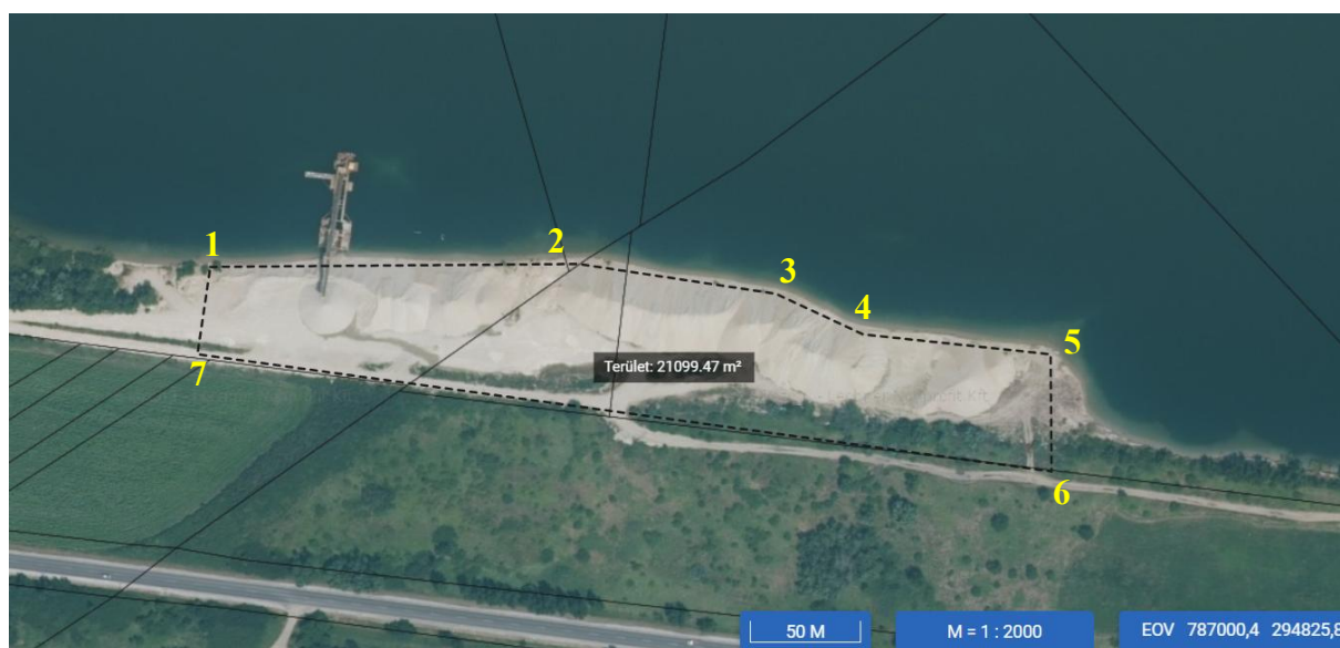
1. ábra: A tervezett osztályozó lehatárolása

A haszonanyag osztályozásához a „Nyékládháza II.-kavics és agyag” védnevű bányatelken elhelyezkedő osztályozót használják.