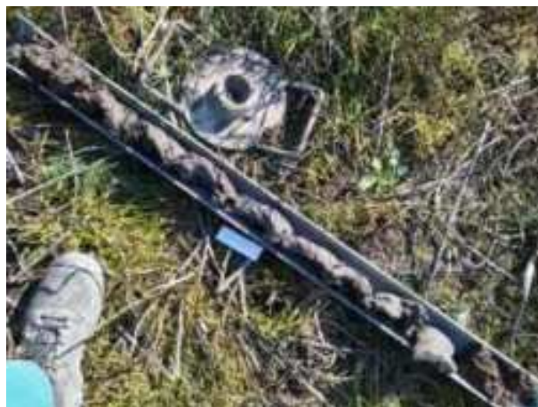
88. ábra: PT23 teljes furadékminta