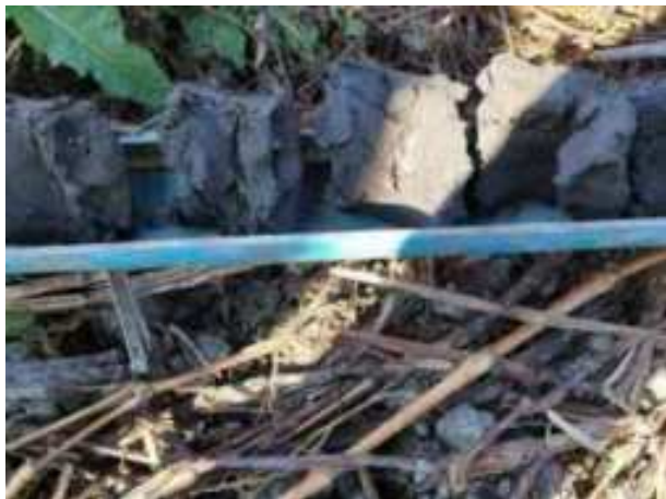
142. ábra: PT31 – 5. részlet