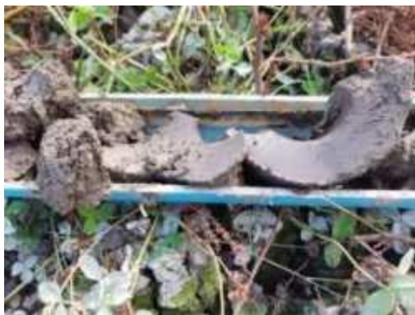
169. ábra: PT35 – 2. részlet