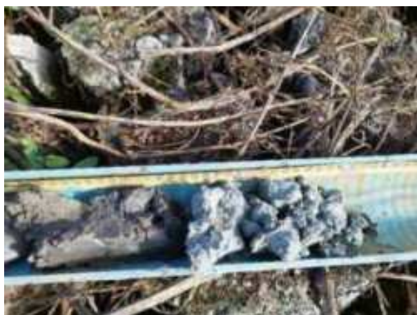
224. ábra: PT44 – 3. részlet