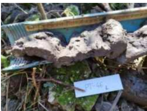
236. ábra: PT46 – 9. részlet