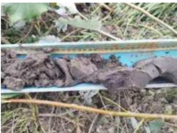
186. ábra: PT38 – 3. részlet