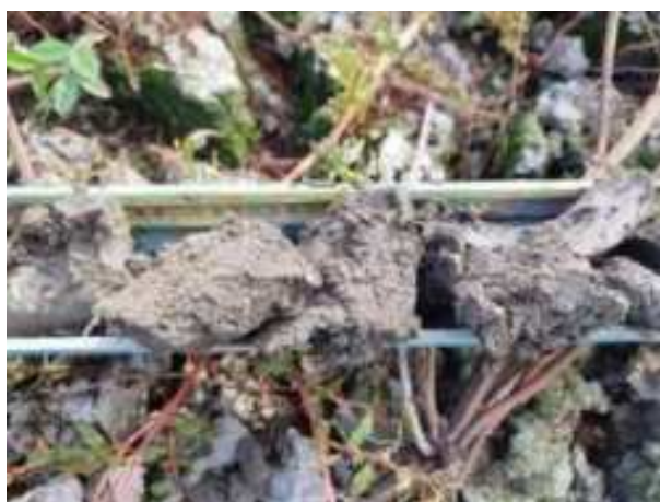
171. ábra: PT35 – 4. részlet