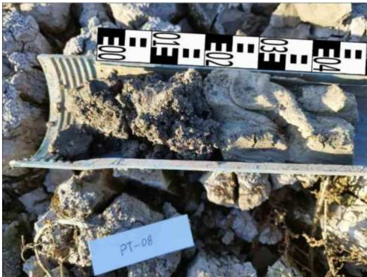
34. ábra: PT08 teljes furadékminta mércével