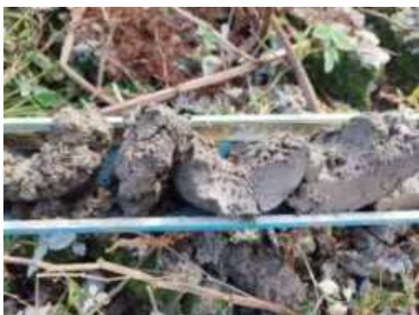
170. ábra: PT35 – 3. részlet