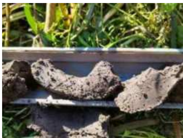
128. ábra: PT30 – 2. részlet