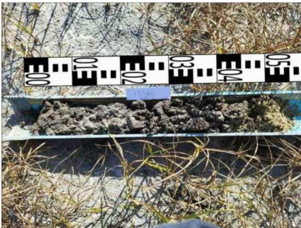
200. ábra: PT40 teljes furadékminta mércével