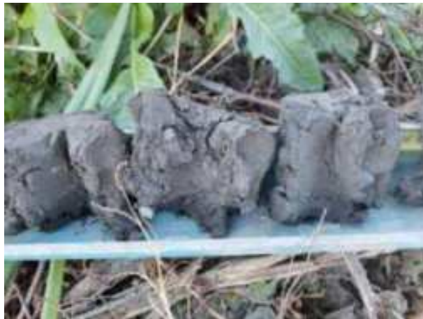
143. ábra: PT31 – 6. részlet