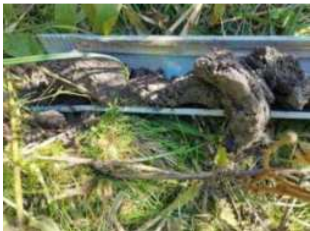
4. ábra: PT01 – 1. részlet