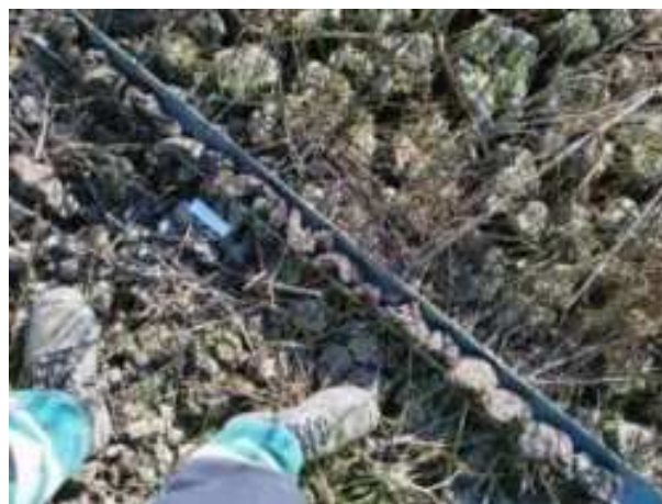
75. ábra: PT20 teljes furadékminta