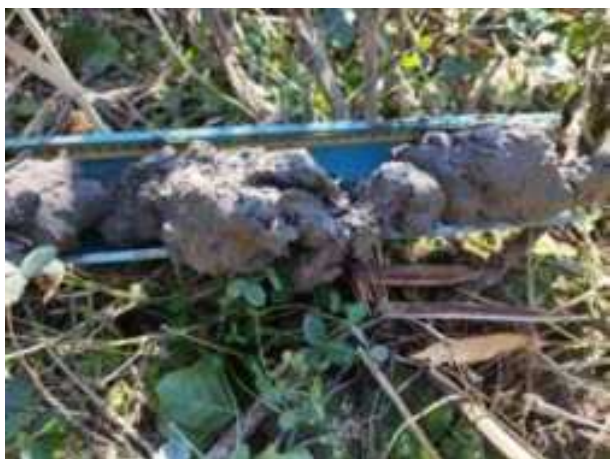
234. ábra: PT46 – 7. részlet