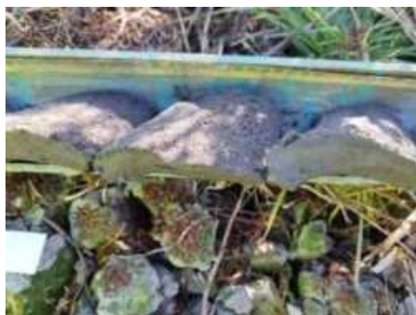
45. ábra: PT09 – 6. részlet