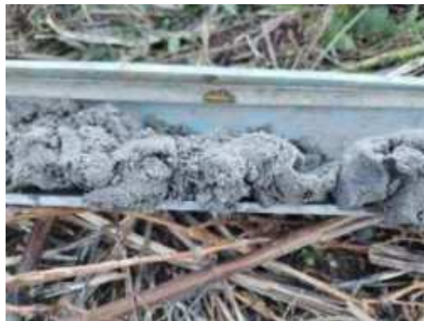
26. ábra: PT07 – 2. részlet