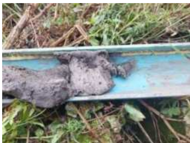
190. ábra: PT38 – 7. részlet