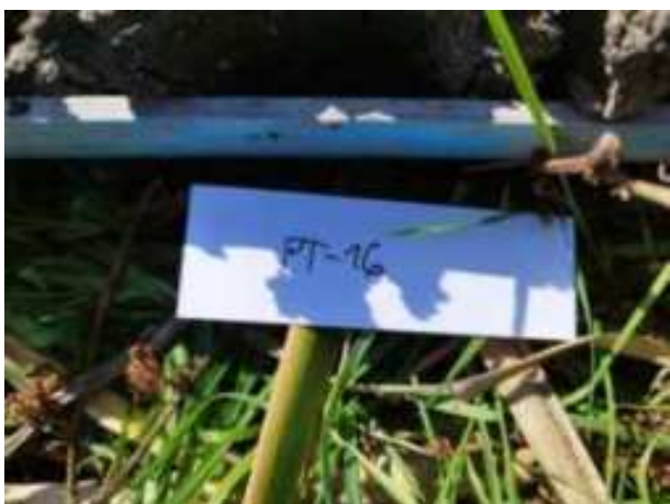
58. ábra: Mintavételi pont azonosító