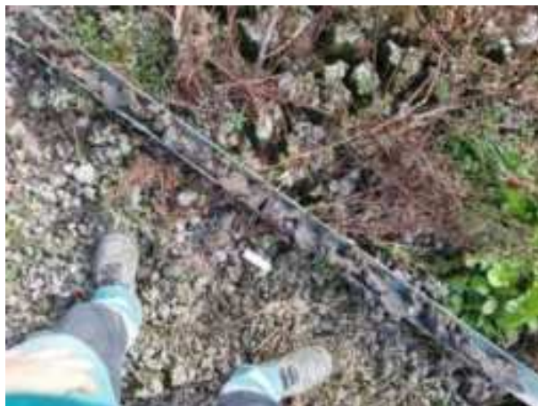
167. ábra: PT35 teljes furadékminta