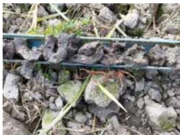
153. ábra: PT32 – 5. részlet