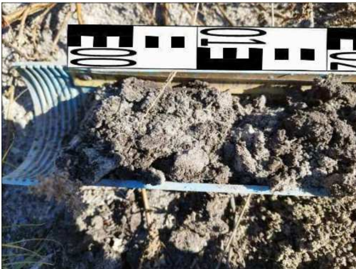
176. ábra: PT36 teljes furadékminta mércével