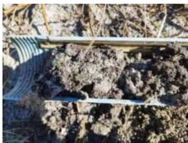
178. ábra: PT36 – 1. részlet