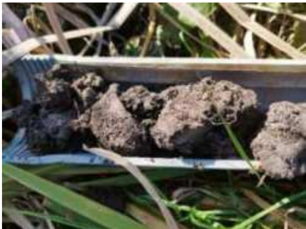
60. ábra: PT16 – 1. részlet