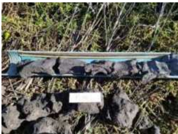
250. ábra: PT48 – 7. részlet