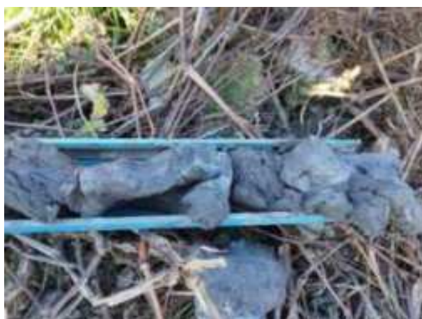
145. ábra: PT31 - 8. részlet