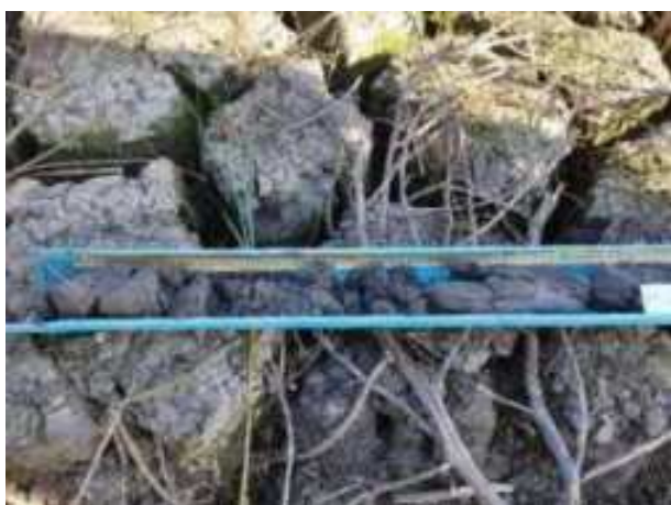
239. ábra: PT47 teljes furadékminta