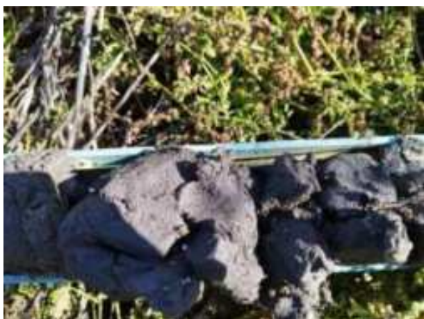
248. ábra: PT48 – 5. részlet