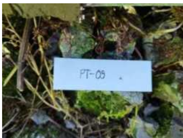
38. ábra: Mintavételi pont azonosító