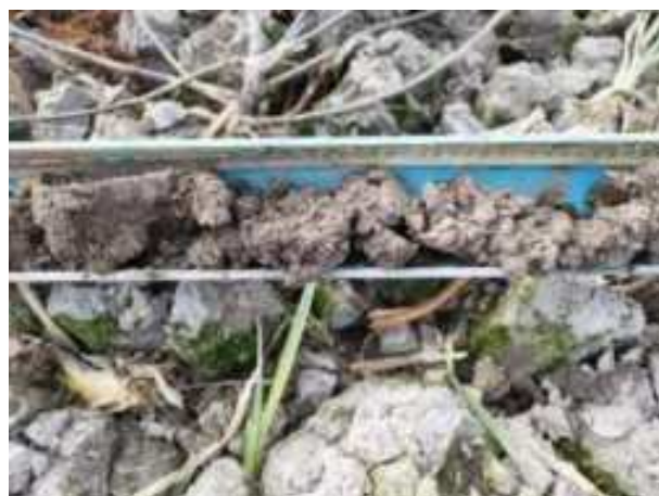
150. ábra: PT32 – 2. részlet