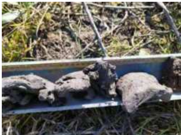
93. ábra: PT23 - 5. részlet