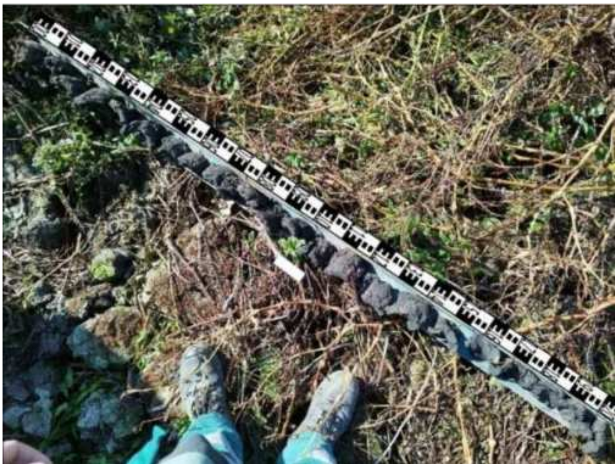
104. ábra: PT27 teljes furadékminta mércével