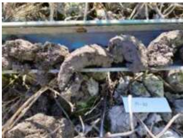
77. ábra: PT20 – 2. részlet