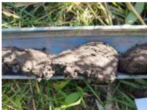
6. ábra: PT01 – 3. részlet