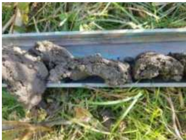
5. ábra: PT01 – 2. részlet