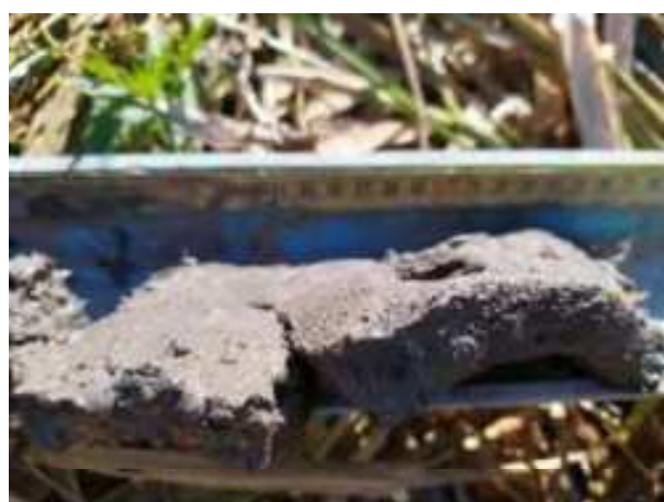
123. ábra: PT28 – 4. részlet