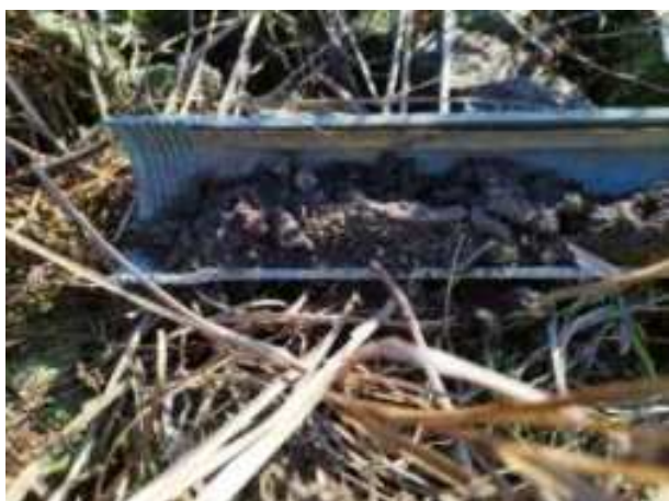
40. ábra: PT09 – 1. részlet