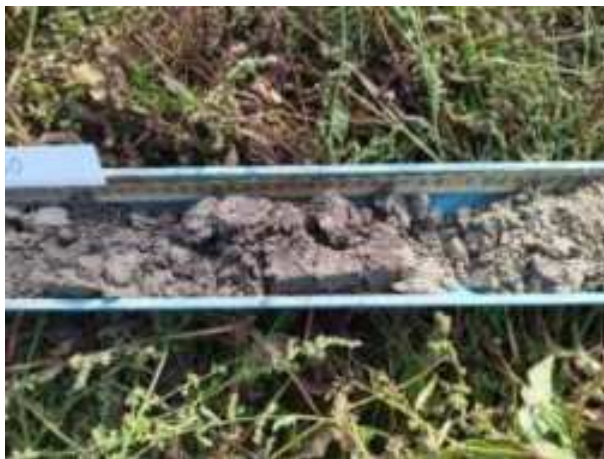
257. ábra: PT50 – 2. részlet