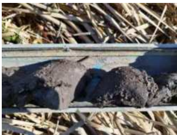
17. ábra: PT03 – 4. részlet