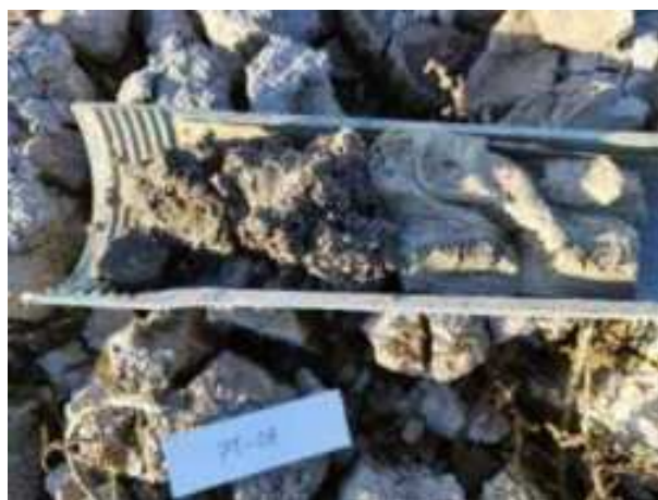
36. ábra: PT08 teljes furadékminta