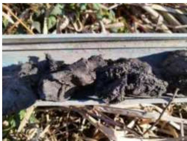
16. ábra: PT03 – 3. részlet