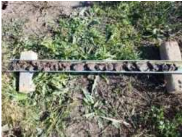
253. ábra: PT49 teljes furadékminta