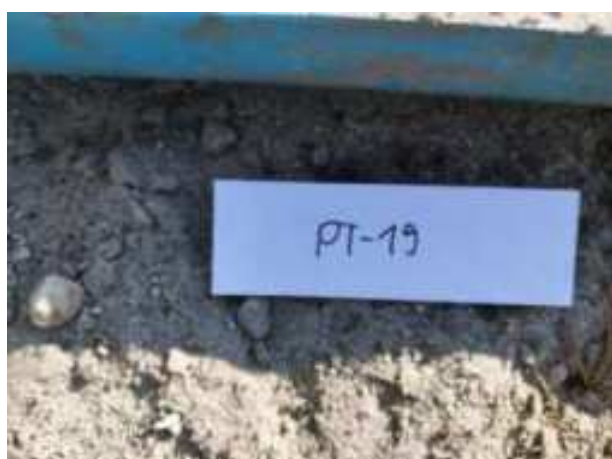
71. ábra: Mintavételi pont azonosító