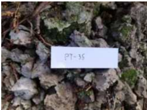
166. ábra: Mintavételi pont azonosító