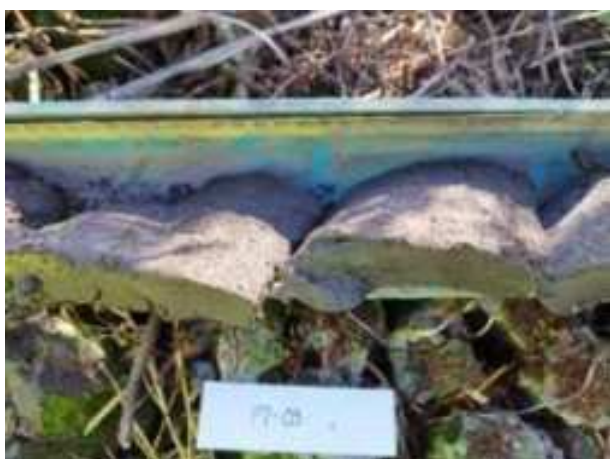
44. ábra: PT09 – 5. részlet