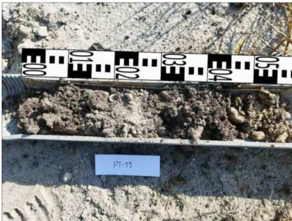
70. ábra: PT19 teljes furadékminta mércével