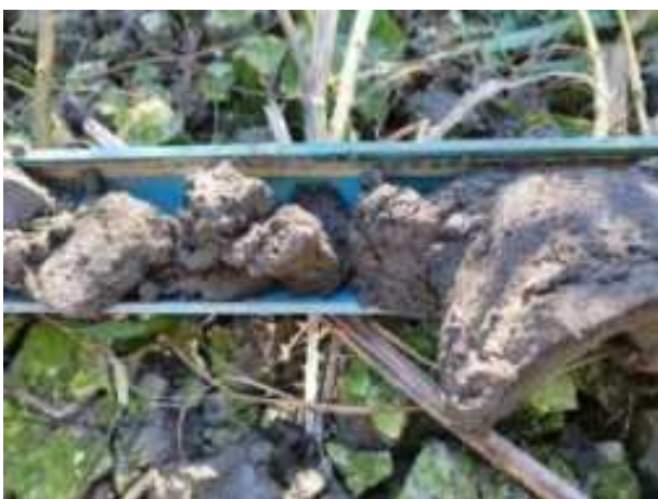
230. ábra: PT46 – 3. részlet