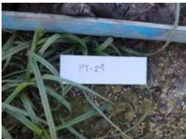
84. ábra: Mintavételi pont azonosító