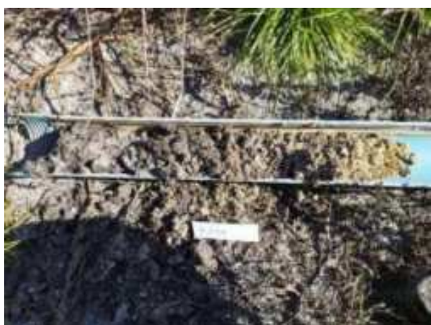
177. ábra: PT36 teljes furadékminta