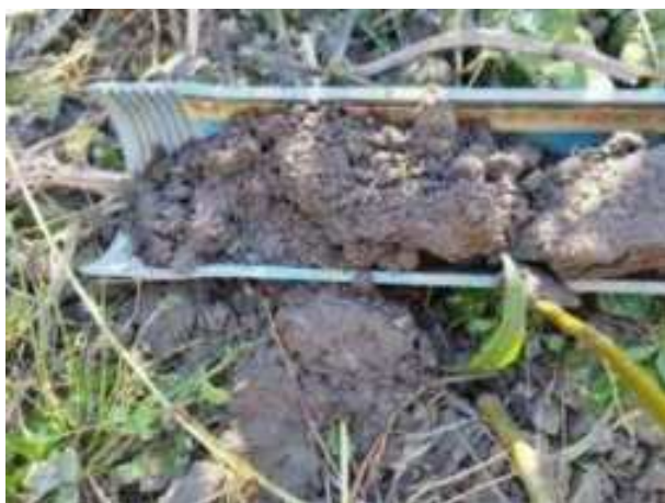
228. ábra: PT46 – 1. részlet