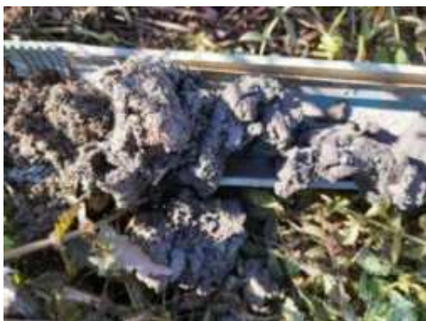
107. ábra: PT27 – 1. részlet