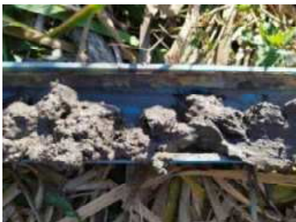
122. ábra: PT28 – 3. részlet