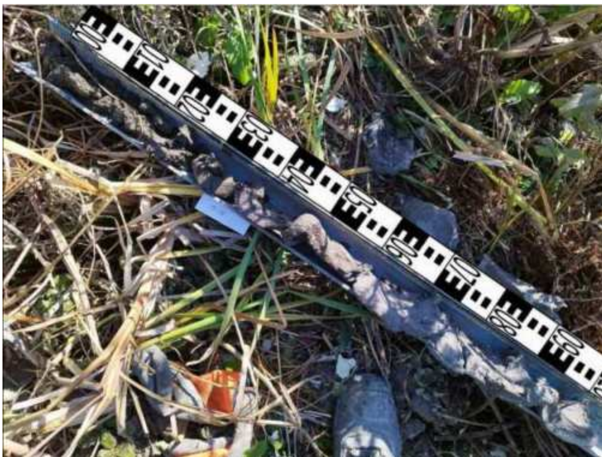
48. ábra: PT13 teljes furadékminta mércével