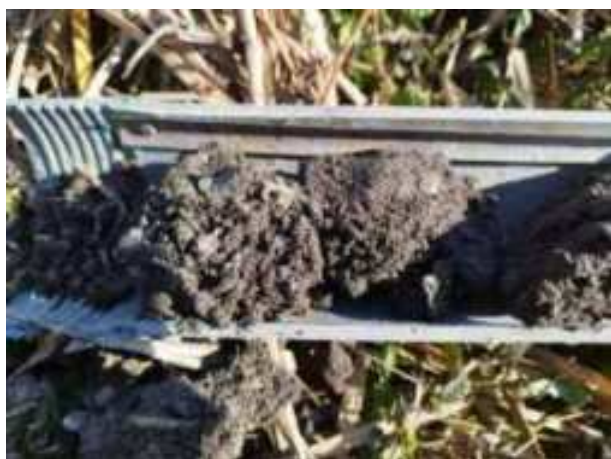
14. ábra: PT03 – 1. részlet