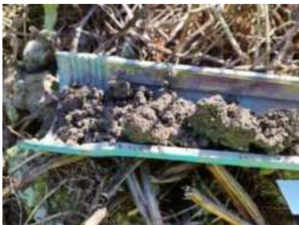
66. ábra: PT18 – 1. részlet