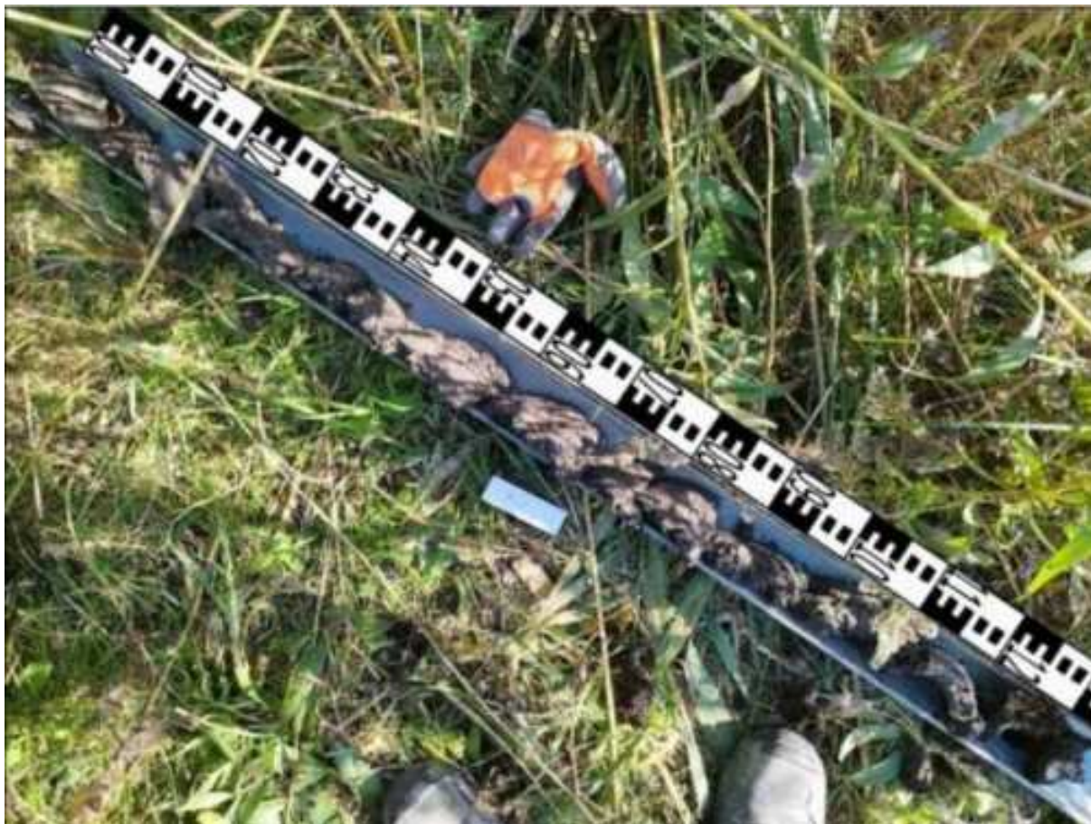
1. ábra: PT01 teljes furadékminta mércével