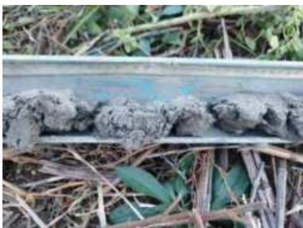
27. ábra: PT07 – 3. részlet