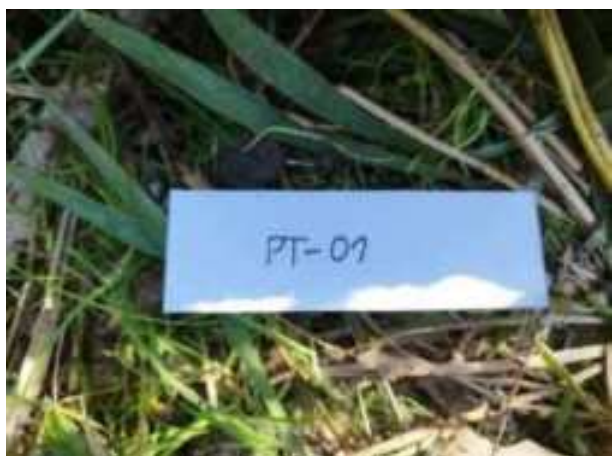
2. ábra: Mintavételi pont azonosító