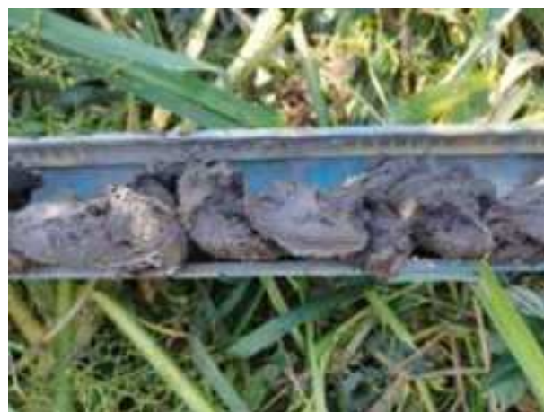
132. ábra: PT30 – 6. részlet