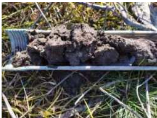
89. ábra: PT23 – 1. részlet