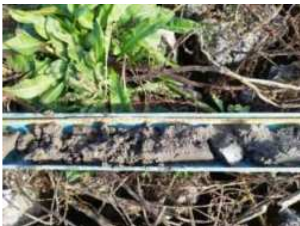
223. ábra: PT44 – 2. részlet