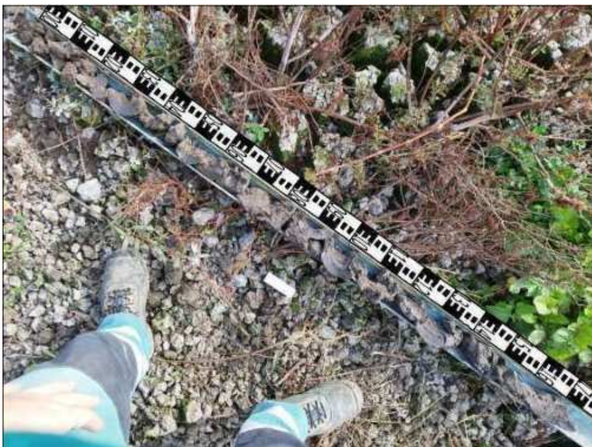
157. ábra: PT34 teljes furadékminta mércével