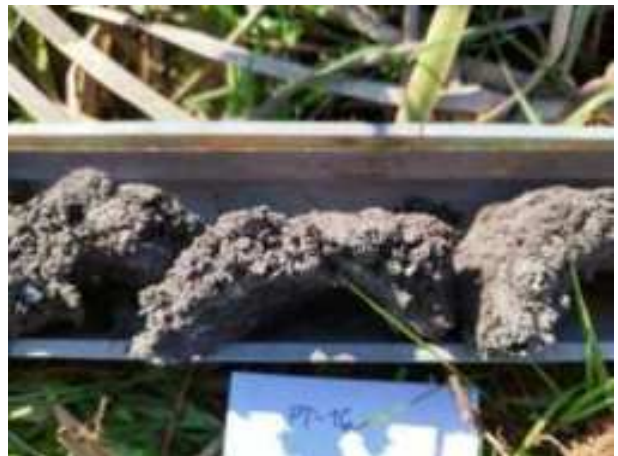
61. ábra: PT16 – 2. részlet