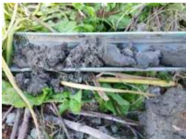
98. ábra: PT25 – 1. részlet