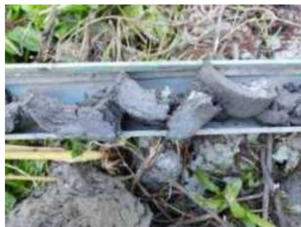
99. ábra: PT25 – 2. részlet