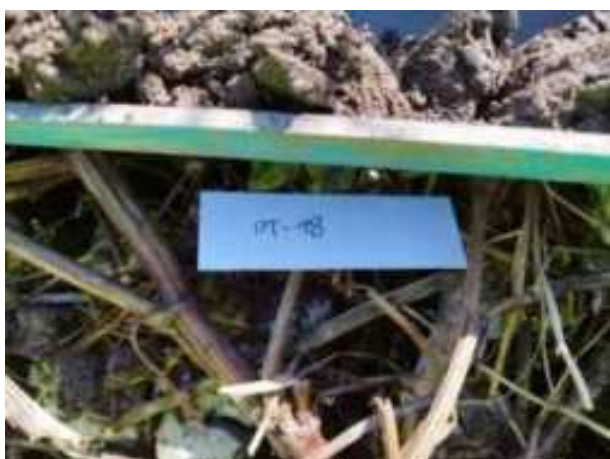
64. ábra: Mintavételi pont azonosító