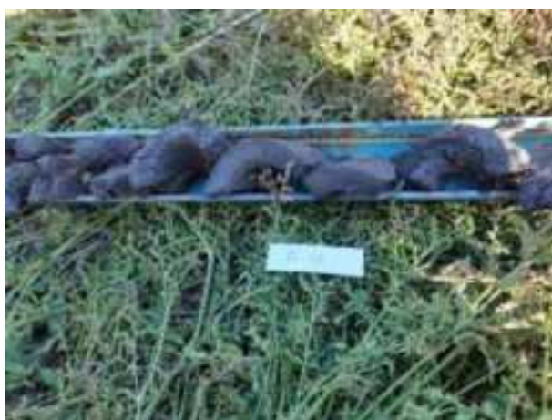
217. ábra: PT43 – 4. részlet