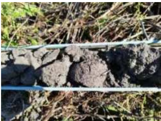
246. ábra: PT48 – 3. részlet