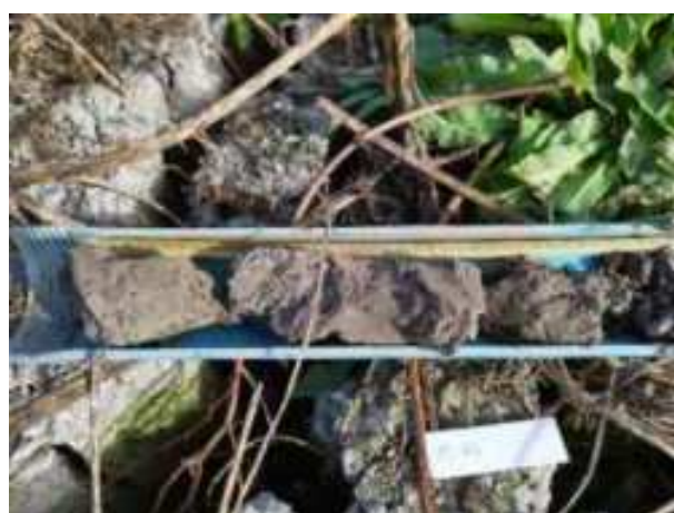
222. ábra: PT44 – 1. részlet