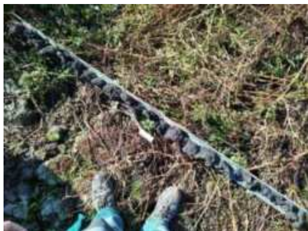
106. ábra: PT27 teljes furadékminta