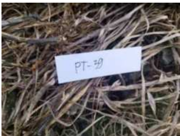
192. ábra: Mintavételi pont azonosító