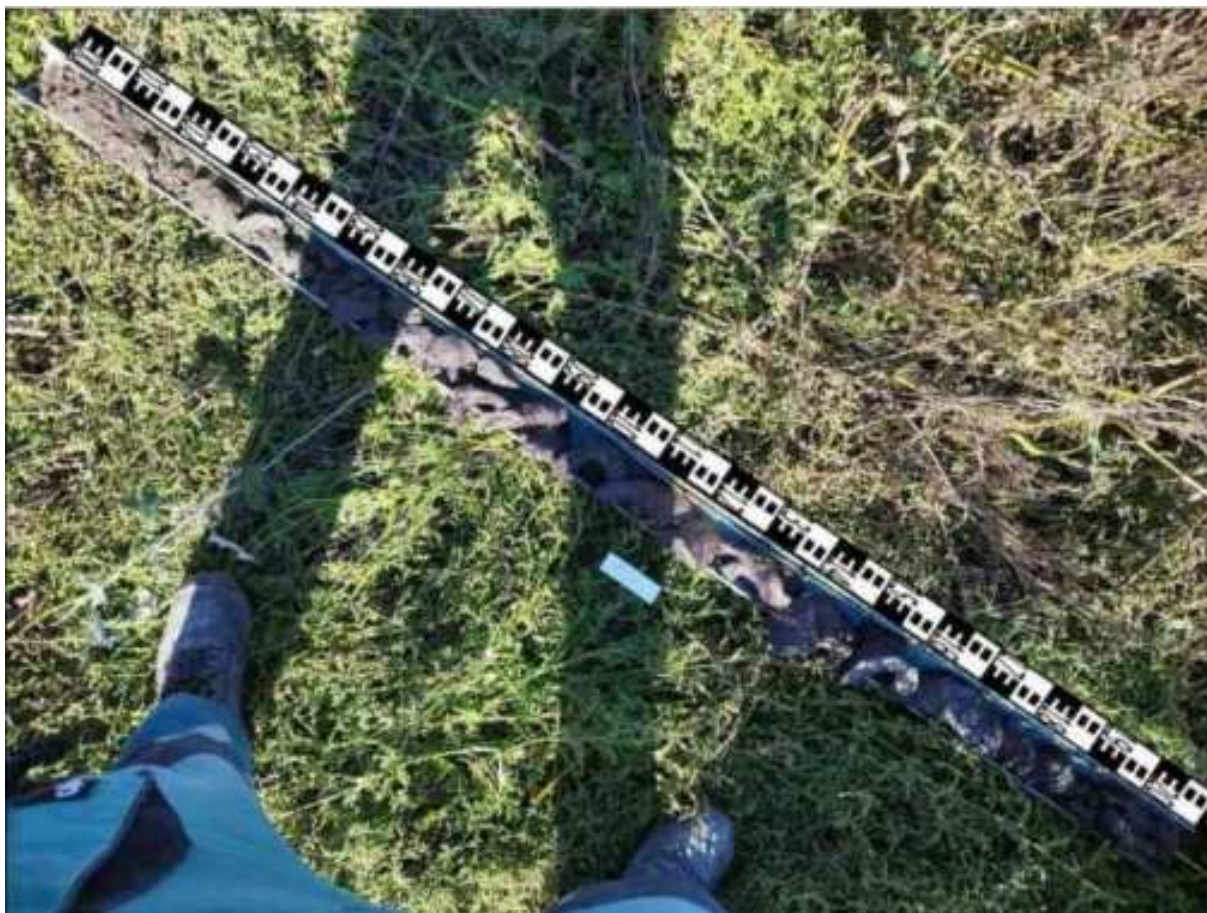
211. ábra: PT43 teljes furadékminta mércével