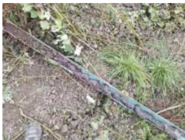
183. ábra: PT38 teljes furadékminta