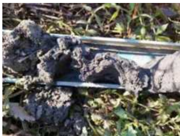
109. ábra: PT27 – 3. részlet