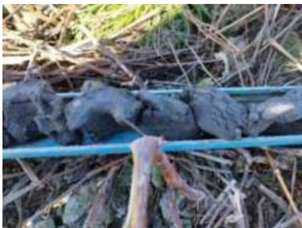
140. ábra: PT31 - 3. részlet