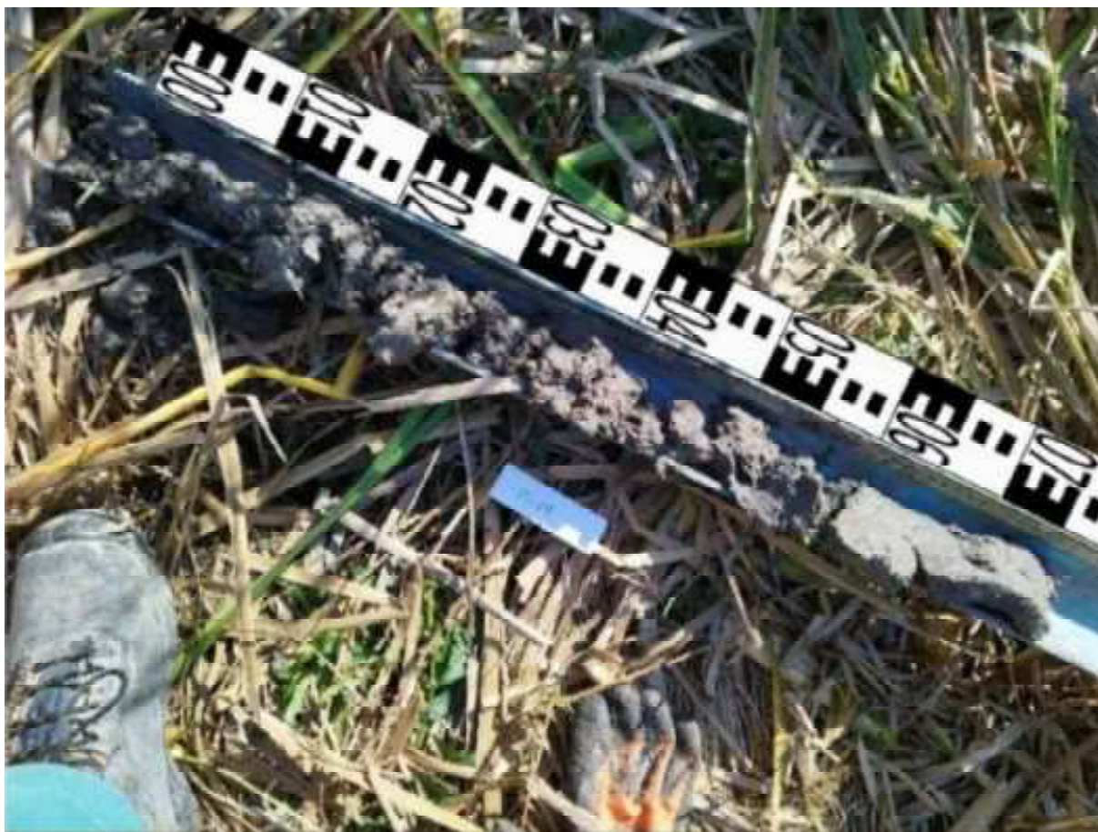
117. ábra: PT28 teljes furadékminta mércével