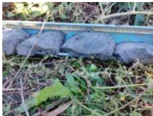
32. ábra: PT07 – 8. részlet