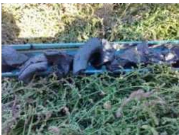
218. ábra: PT43 – 5. részlet