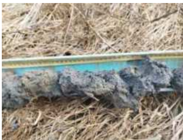
197. ábra: PT39 – 4. részlet