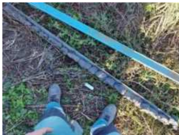
24. ábra: PT07 teljes furadékminta