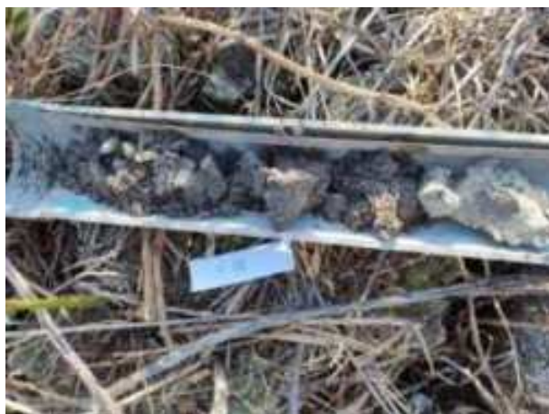
21. ábra: PT06 teljes furadékminta