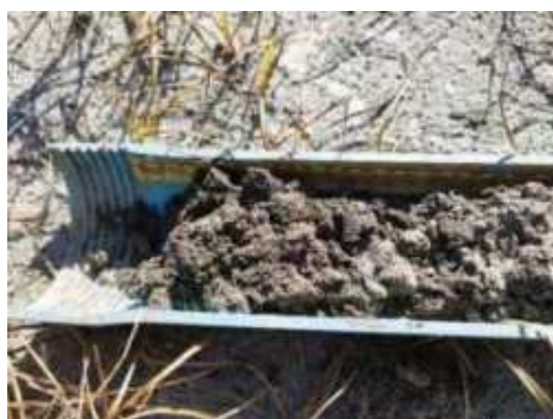
202. ábra: PT40 – 1. részlet