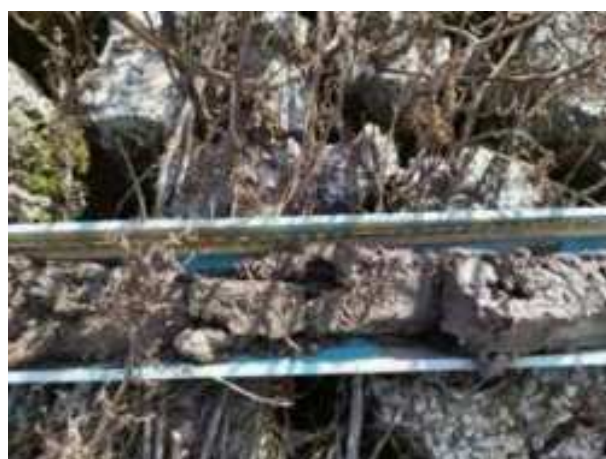
208. ábra: PT42 – 2. részlet