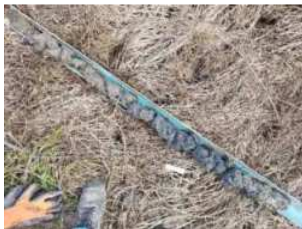
193. ábra: PT39 teljes furadékminta