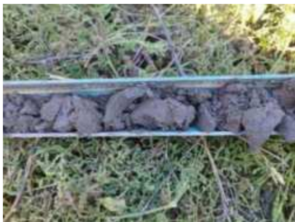
215. ábra: PT43 – 2. részlet