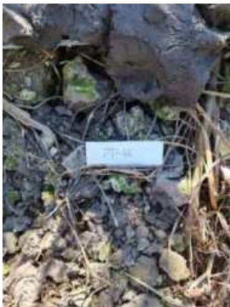
226. ábra: Mintavételi pont azonosító