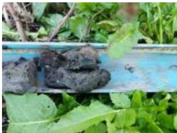
103. ábra: PT25 - 6. részlet