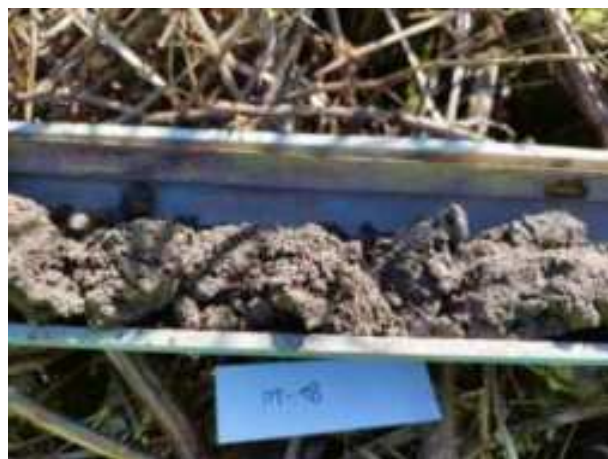
67. ábra: PT18 – 2. részlet