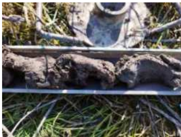
90. ábra: PT23 – 2. részlet