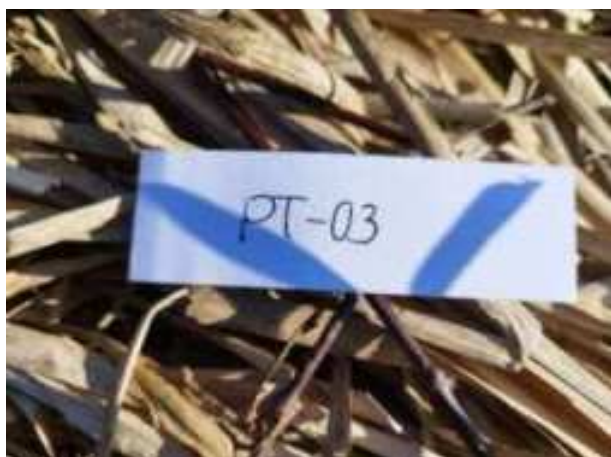
12. ábra: Mintavételi pont azonosító