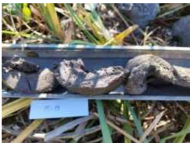
53. ábra: PT13 – 3. részlet