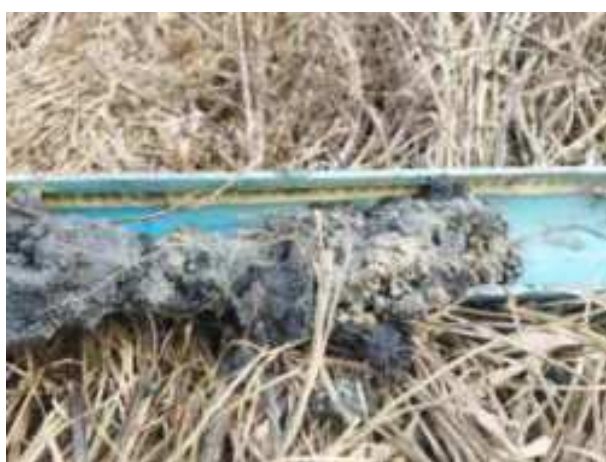
199. ábra: PT39 – 6. részlet