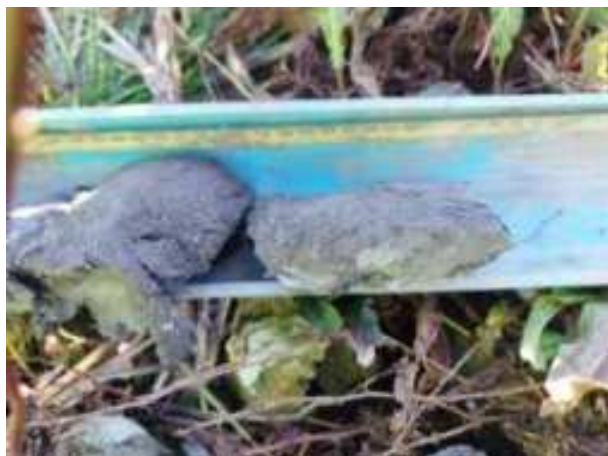
47. ábra: PT09 – 8. részlet