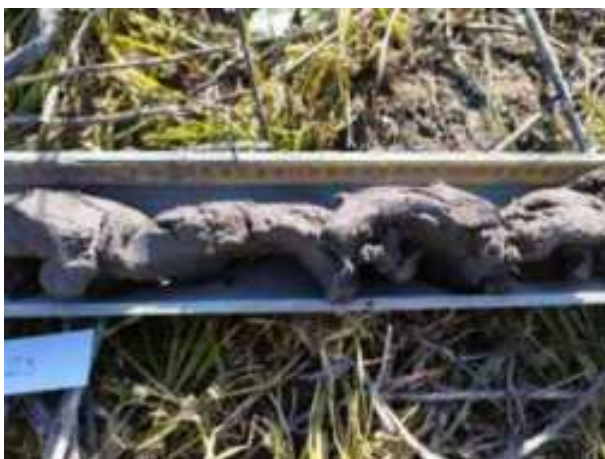
92. ábra: PT23 - 4. részlet