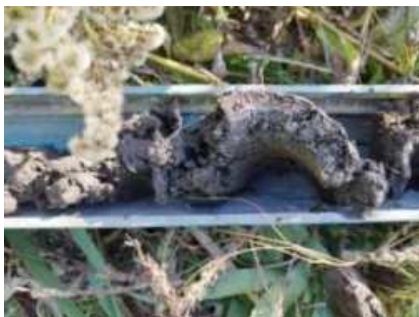
9. ábra: PT01 – 6. részlet