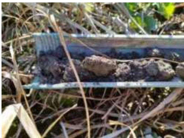
51. ábra: PT13 – 1. részlet