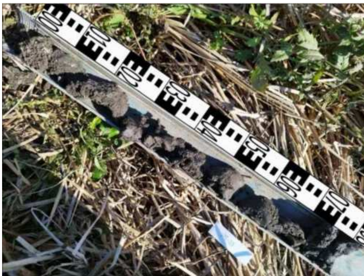
11. ábra: PT03 teljes furadékminta mércével