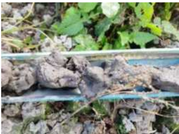
174. ábra: PT35 - 7. részlet