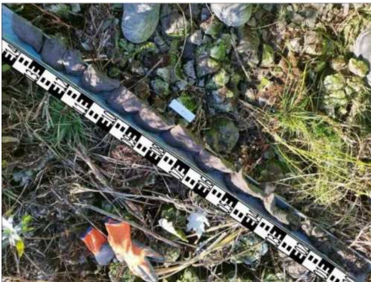
37. ábra: PT09 teljes furadékminta mércével