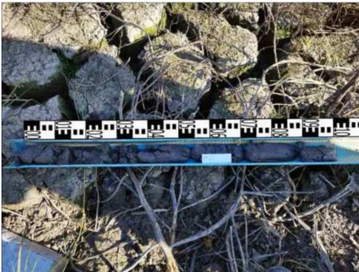
238. ábra: PT47 teljes furadékminta mércével