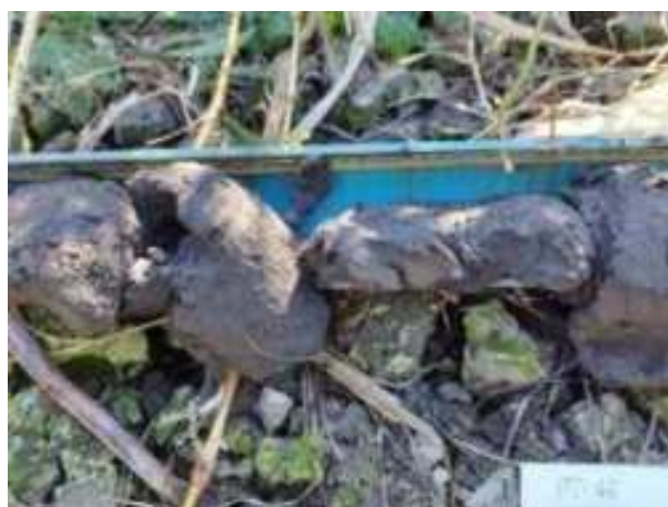
231. ábra: PT46 – 4. részlet