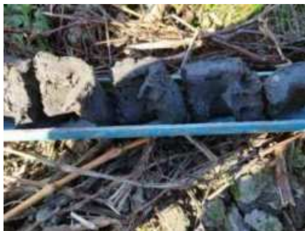
141. ábra: PT31 – 4. részlet