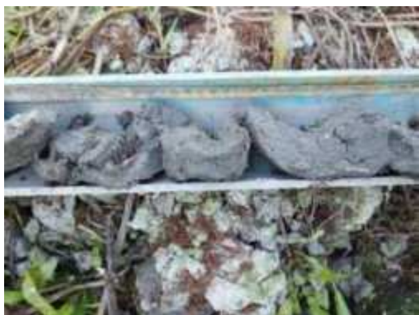
100. ábra: PT25 - 3. részlet