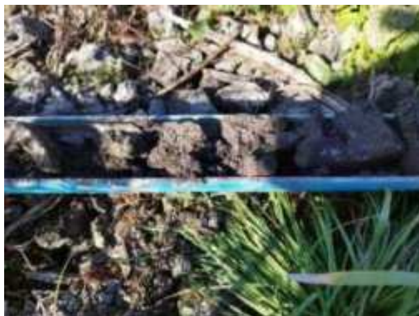
139. ábra: PT31 – 2. részlet