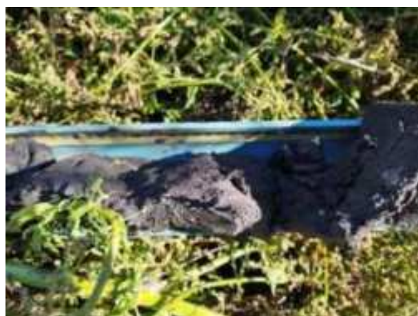
249. ábra: PT48 – 6. részlet