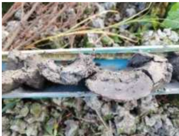
173. ábra: PT35 – 6. részlet