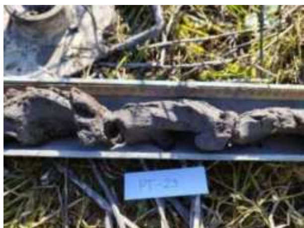
91. ábra: PT23 - 3. részlet