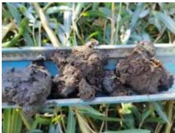
134. ábra: PT30 – 8. részlet