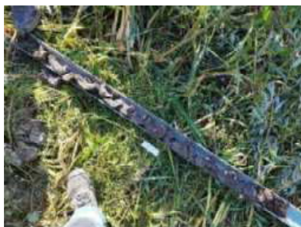
126. ábra: PT30 teljes furadékminta