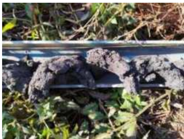
108. ábra: PT27 – 2. részlet