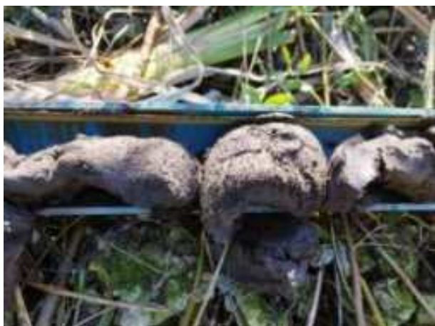
232. ábra: PT46 – 5. részlet