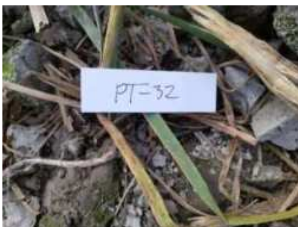
147. ábra: PT32 mintavételi pont azonosító