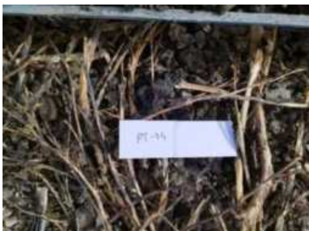
158. ábra: Mintavételi pont azonosító