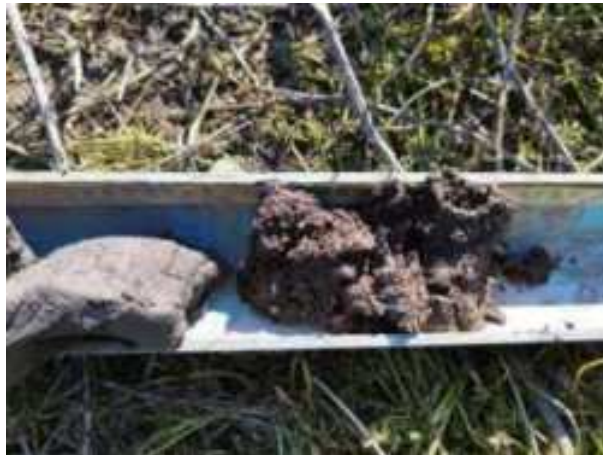
94. ábra: PT23 - 6. részlet