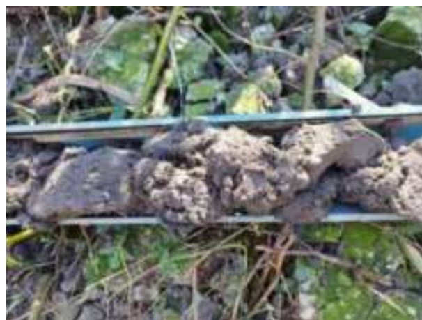
229. ábra: PT46 – 2. részlet