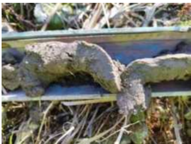
42. ábra: PT09 – 3. részlet