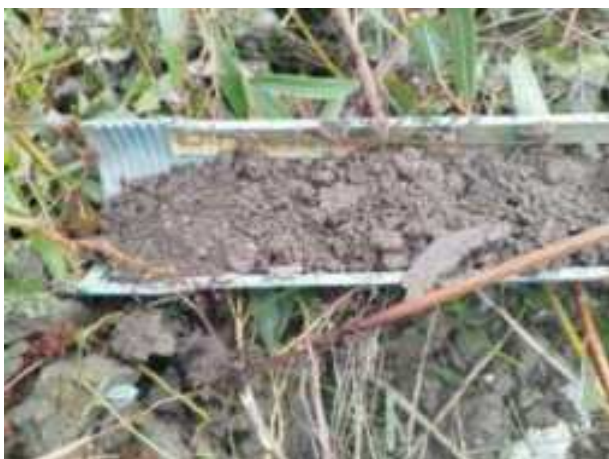
184. ábra: PT38 – 1. részlet