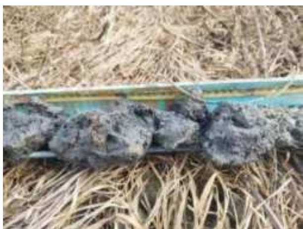
198. ábra: PT39 – 5. részlet