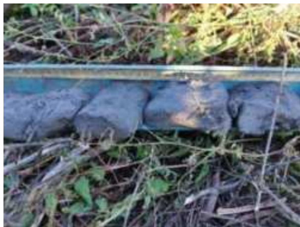
30. ábra: PT07 – 6. részlet