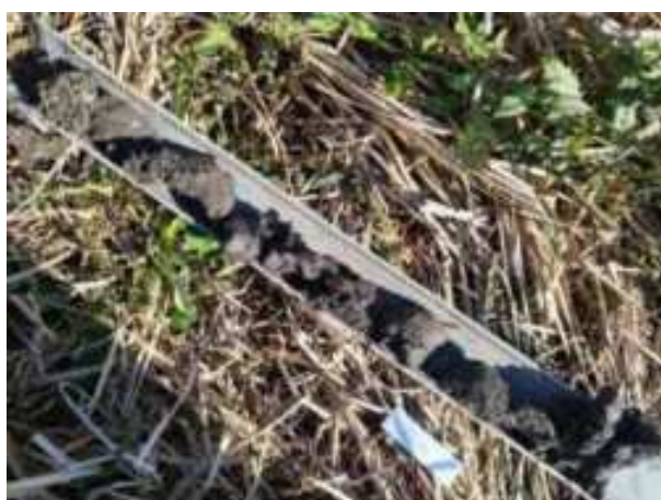
13. ábra: PT03 teljes furadékminta