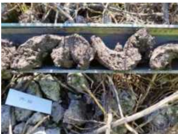
78. ábra: PT20 – 3. részlet