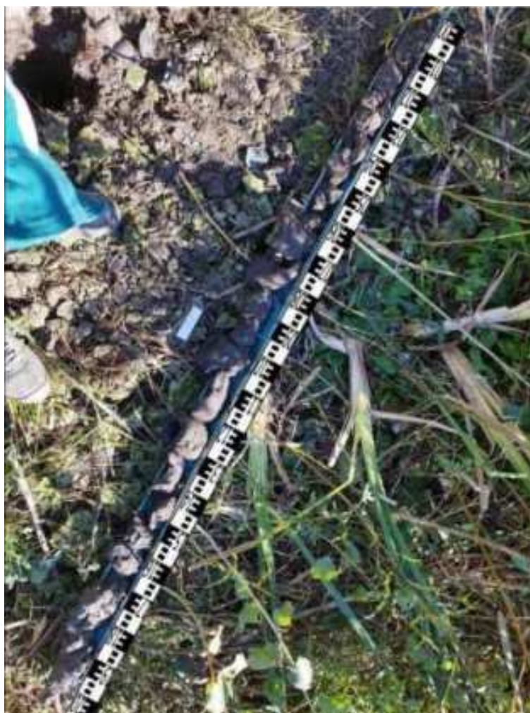
225. ábra: PT46 teljes furadékminta mércével