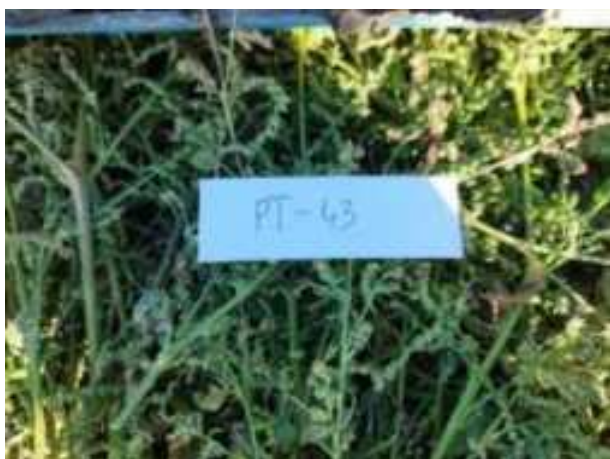
212. ábra: Mintavételi pont azonosító