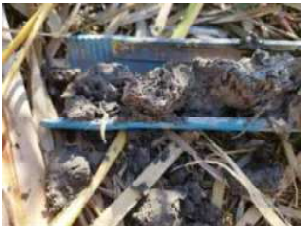
120. ábra: PT28 – 1. részlet