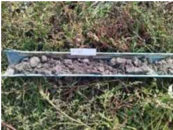
255. ábra: PT50 teljes furadékminta