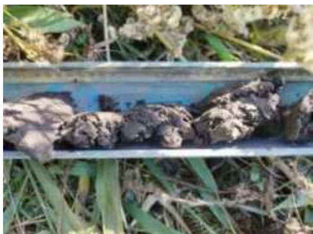
8. ábra: PT01 – 5. részlet