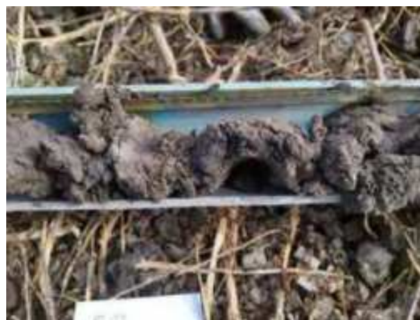
163. ábra: PT34 – 4. részlet