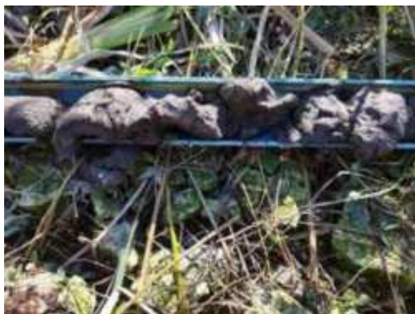
233. ábra: PT46 – 6. részlet