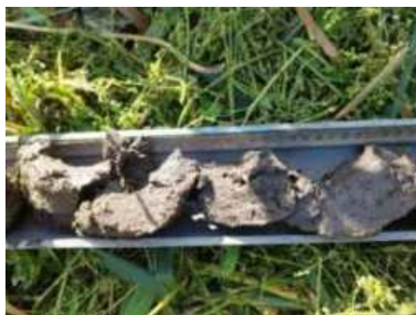
130. ábra: PT30 – 4. részlet