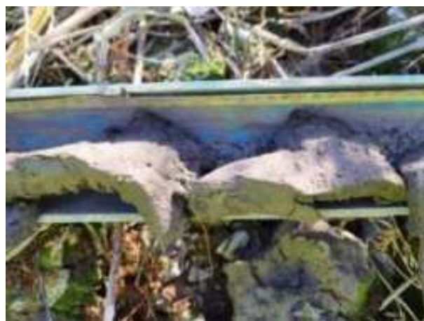
43. ábra: PT09 – 4. részlet