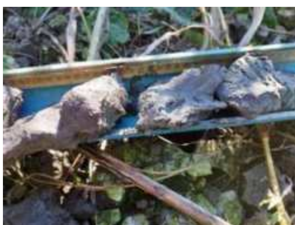
237. ábra: PT46 – 10. részlet