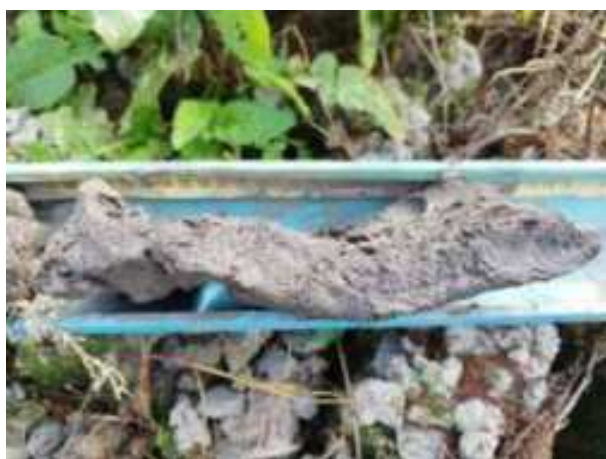
175. ábra: PT35 - 8. részlet