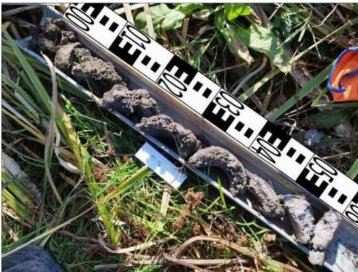
57. ábra: PT16 teljes furadékminta mércével