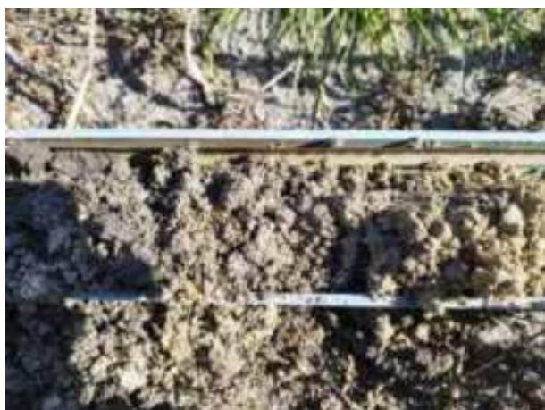
179. ábra: PT36 – 2. részlet