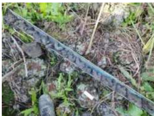
97. ábra: PT25 teljes furadékminta