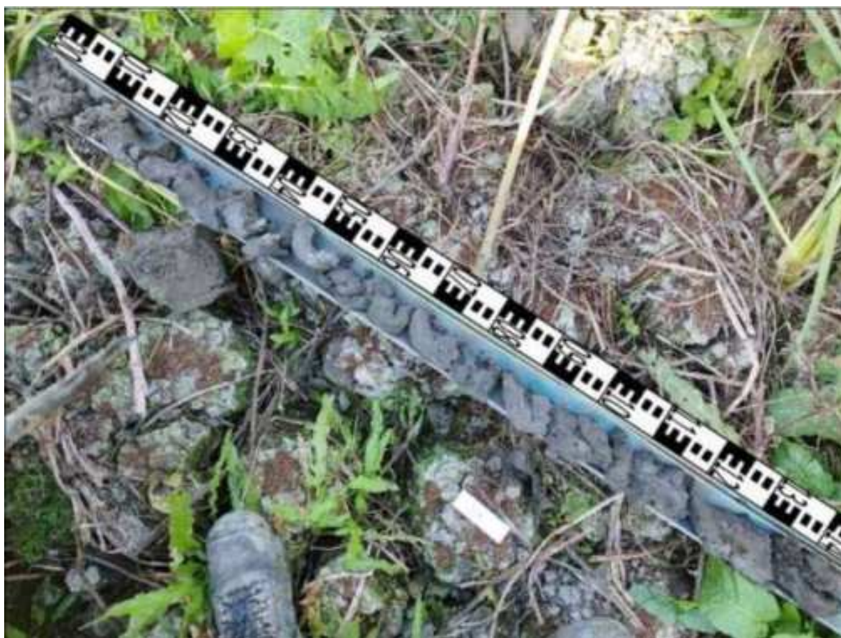
95. ábra: PT25 teljes furadékminta mércével