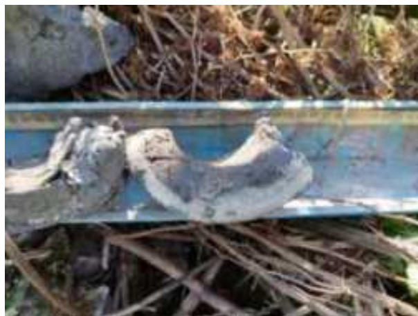
56. ábra: PT13 – 6. részlet