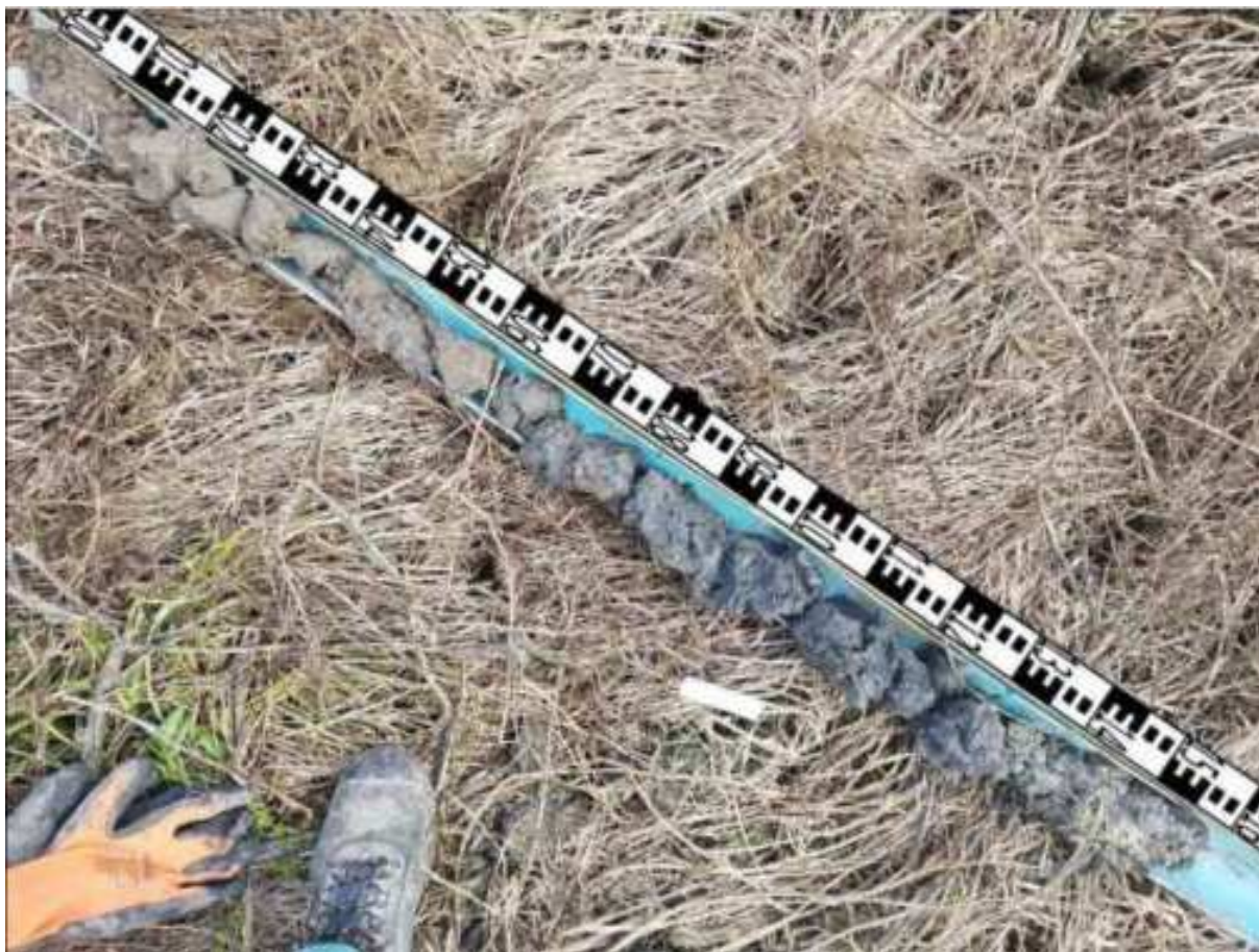
191. ábra: PT39 teljes furadékminta mércével