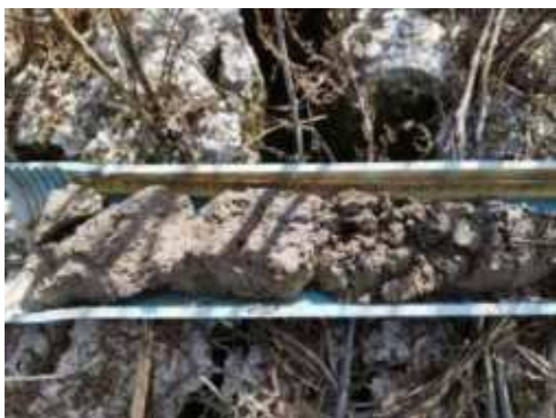
207. ábra: PT42 – 1. részlet