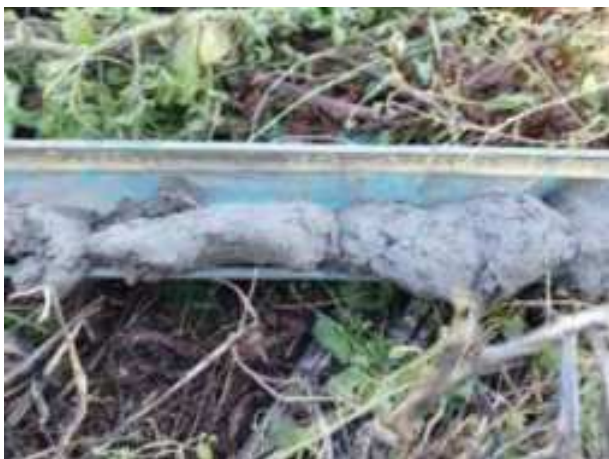
29. ábra: PT07 – 5. részlet