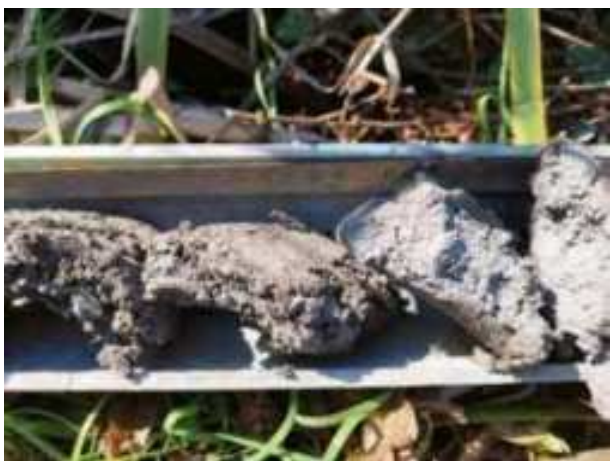
62. ábra: PT16 – 3. részlet