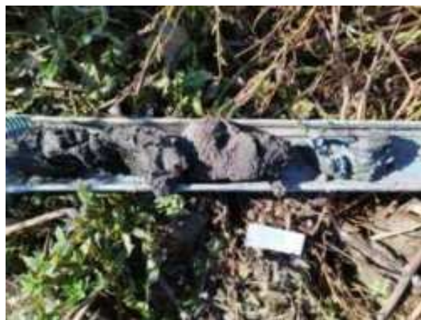
116. ábra: PT27 – 10. részlet