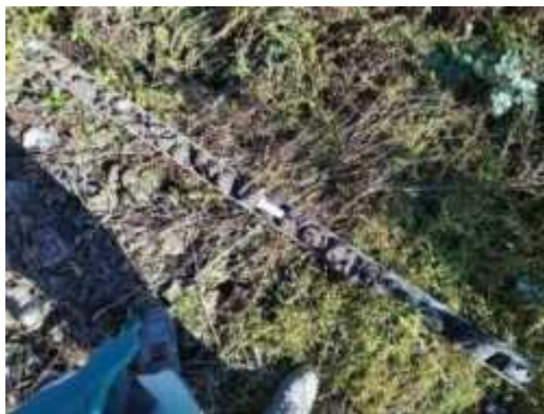
243. ábra: PT48 teljes furadékminta