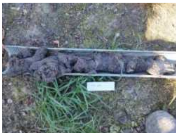
85. ábra: PT21 teljes furadékminta