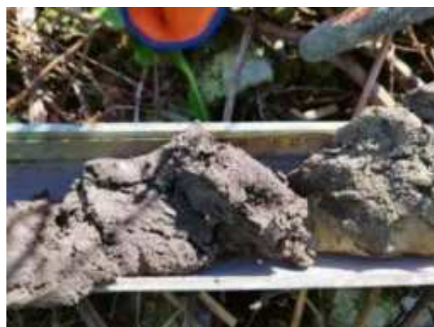
69. ábra: PT18 – 4. részlet