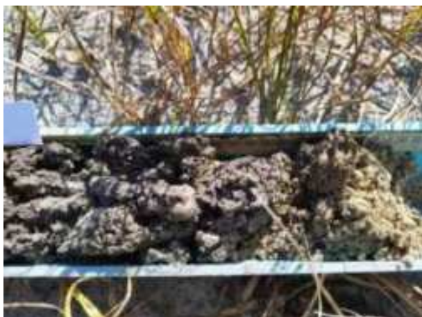
203. ábra: PT40 – 2. részlet