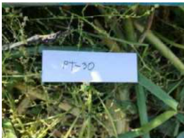
125. ábra: Mintavételi pont azonosító