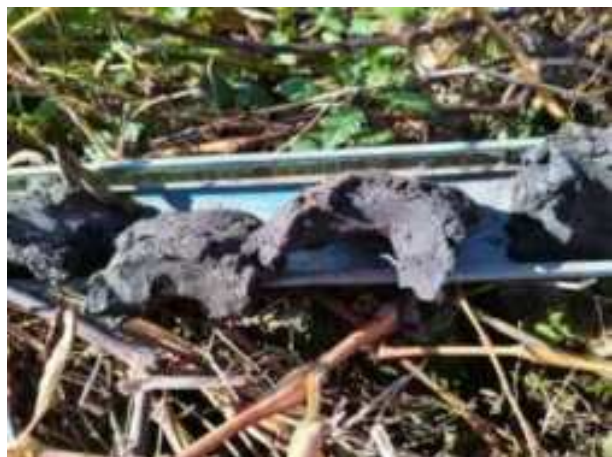
113. ábra: PT27 – 7. részlet