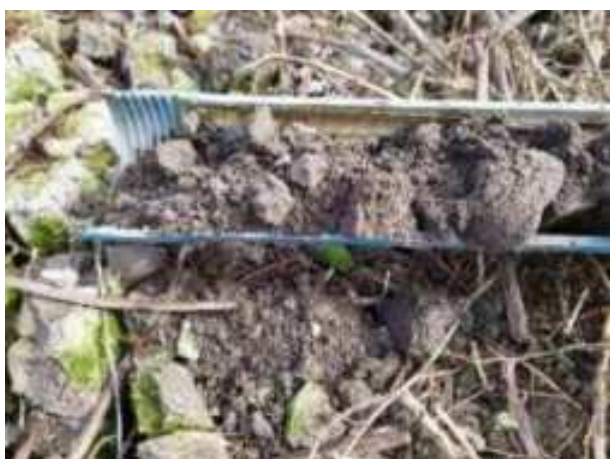
160. ábra: PT34 – 1. részlet