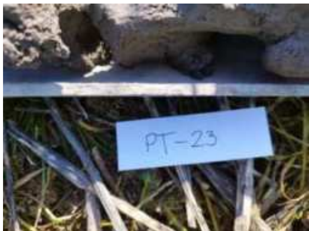
87. ábra: Mintavételi pont azonosító