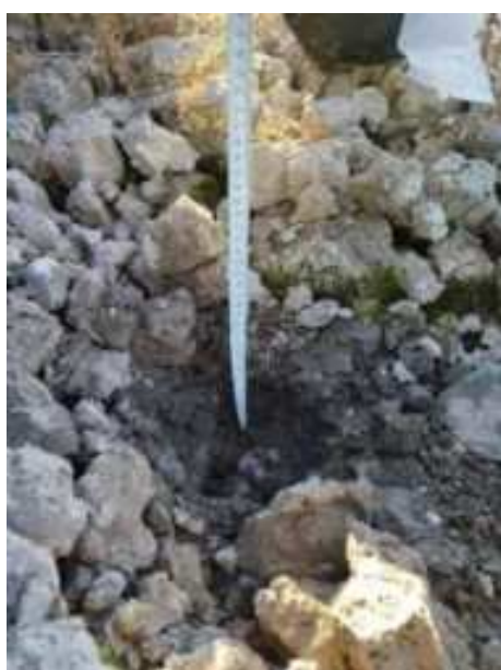
35. ábra: Mintavételi pont azonosító