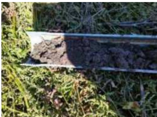
214. ábra: PT43 – 1. részlet