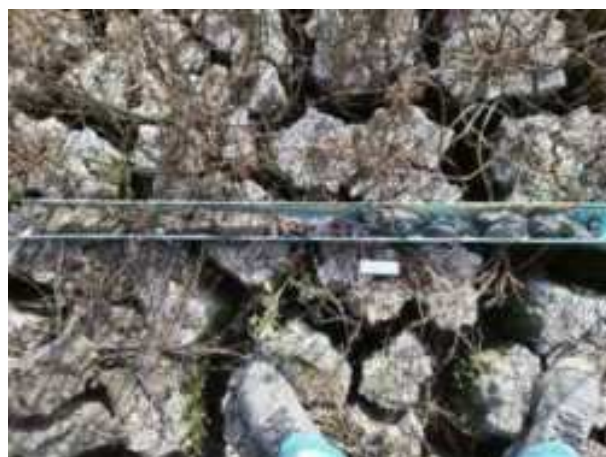
206. ábra: PT42 teljes furadékminta