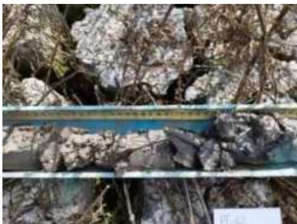
209. ábra: PT42 – 3. részlet