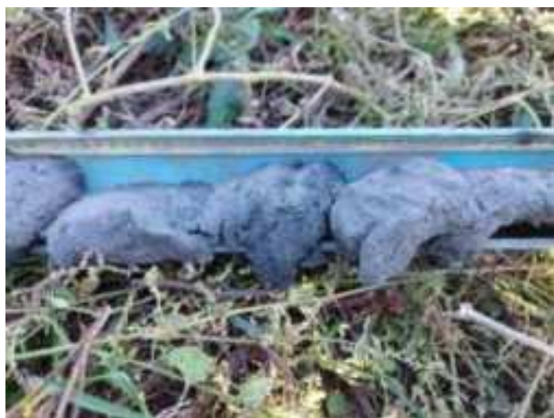
31. ábra: PT07 – 7. részlet