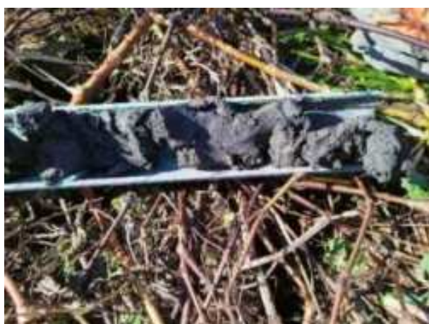
115. ábra: PT27 – 9. részlet