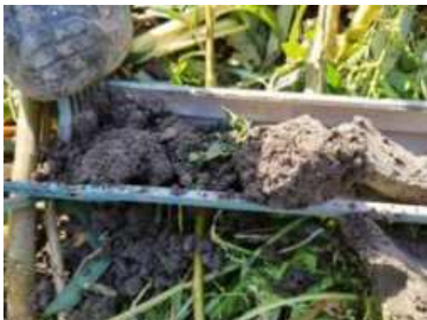
127. ábra: PT30 – 1. részlet