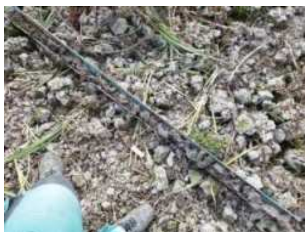
148. ábra: PT32 teljes furadékminta