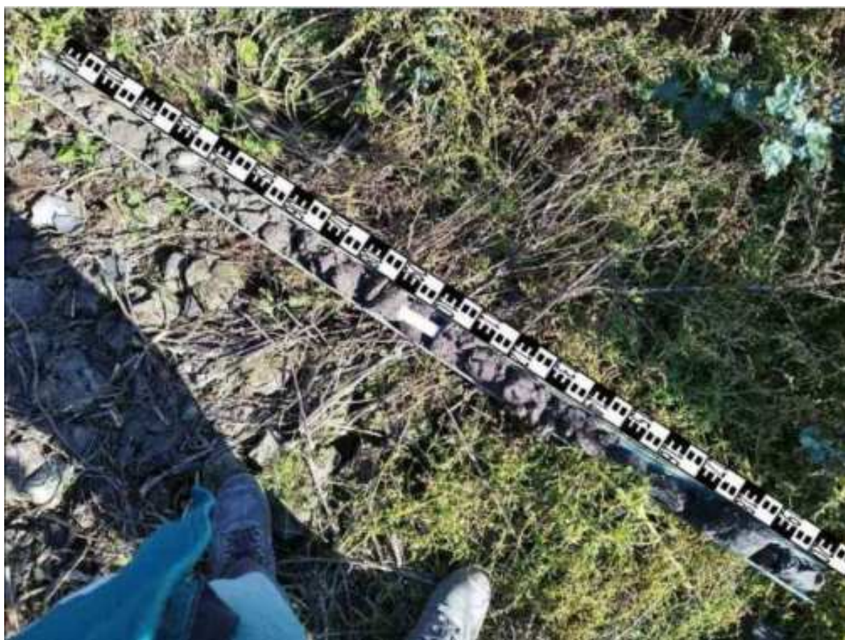
252. ábra: PT49 teljes furadékminta mércével