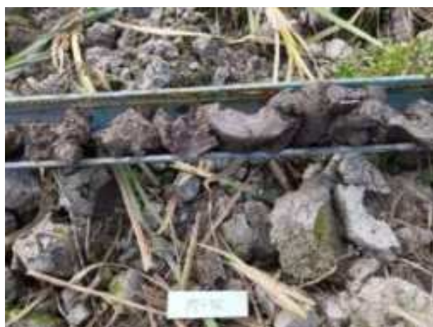
152. ábra: PT32 – 4. részlet