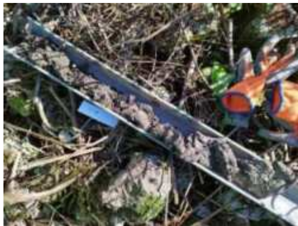
65. ábra: PT18 teljes furadékminta