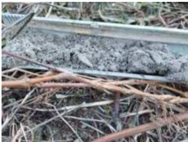
25. ábra: PT07 – 1. részlet