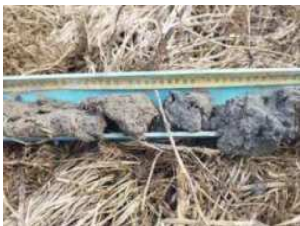
196. ábra: PT39 – 3. részlet