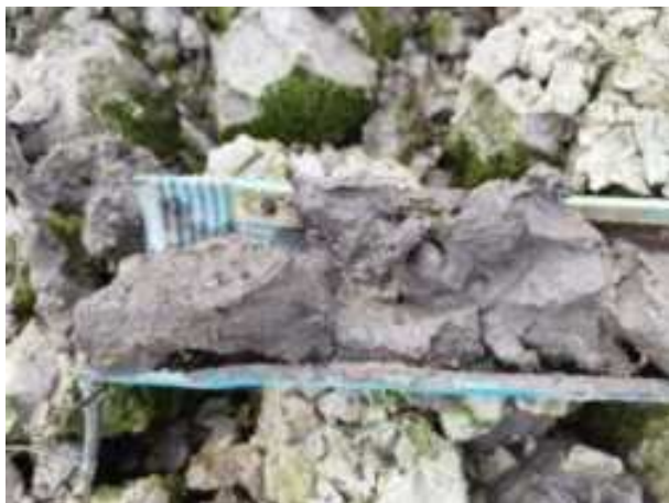
155. ábra: PT32 – 7. részlet