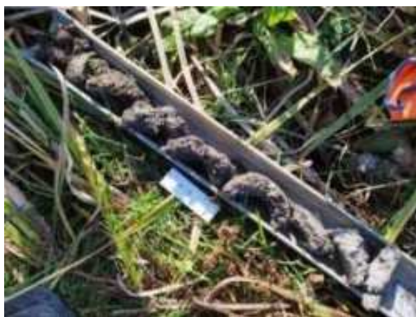
59. ábra: PT16 teljes furadékminta