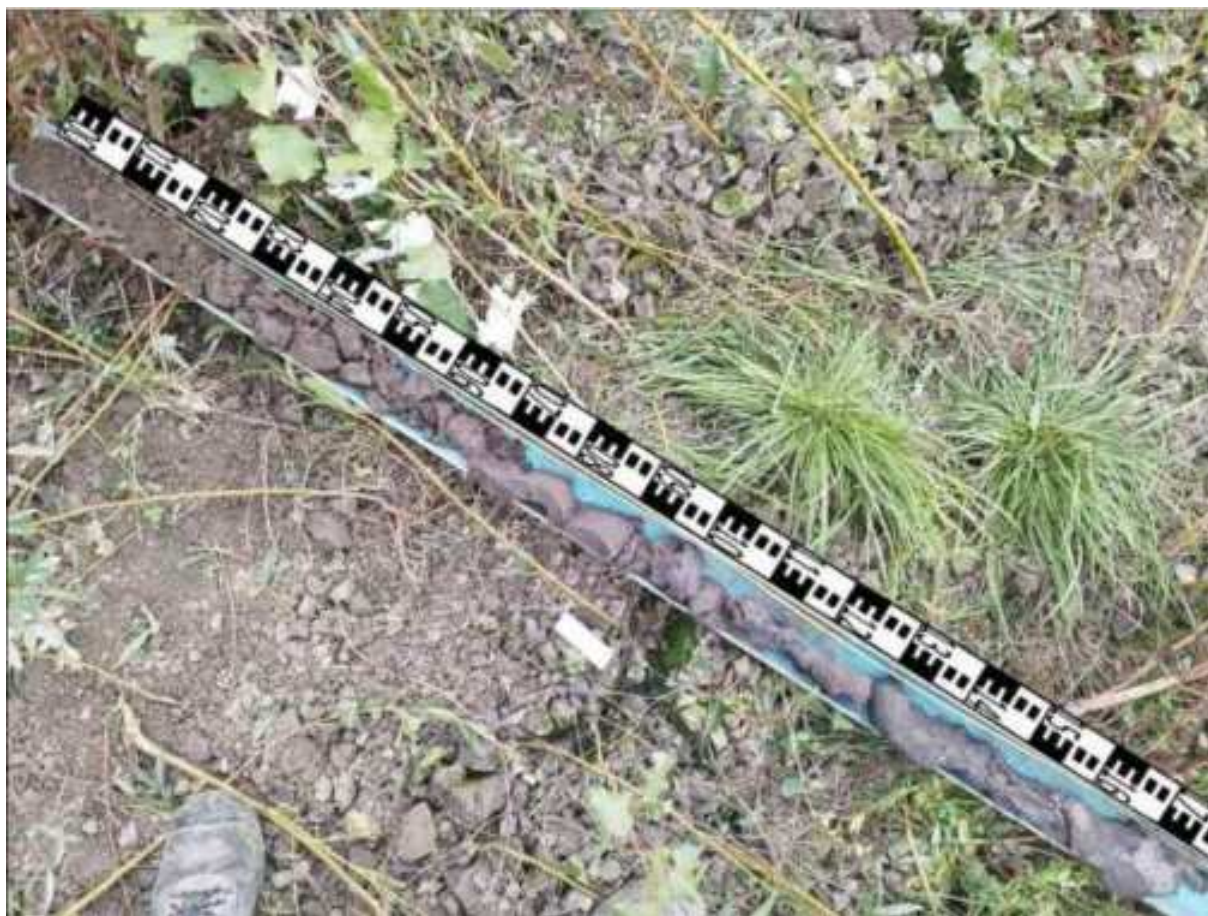
181. ábra: PT38 teljes furadékminta mércével