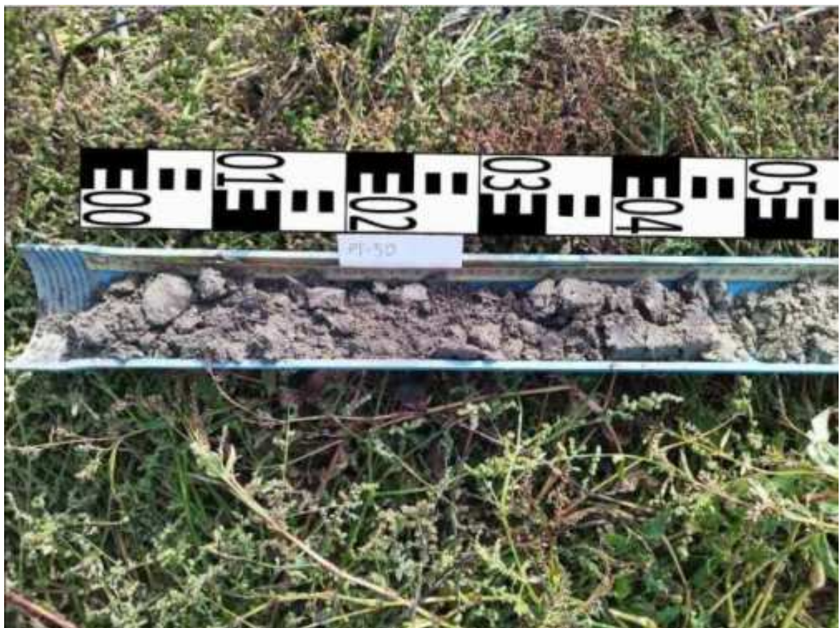
254. ábra: PT50 teljes furadékminta mércével