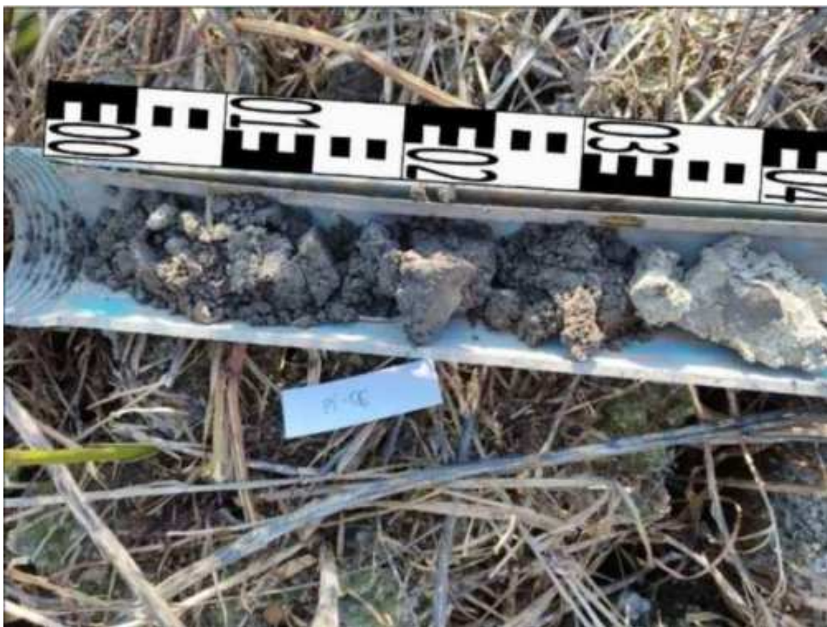
19. ábra: PT06 teljes furadékminta mércével