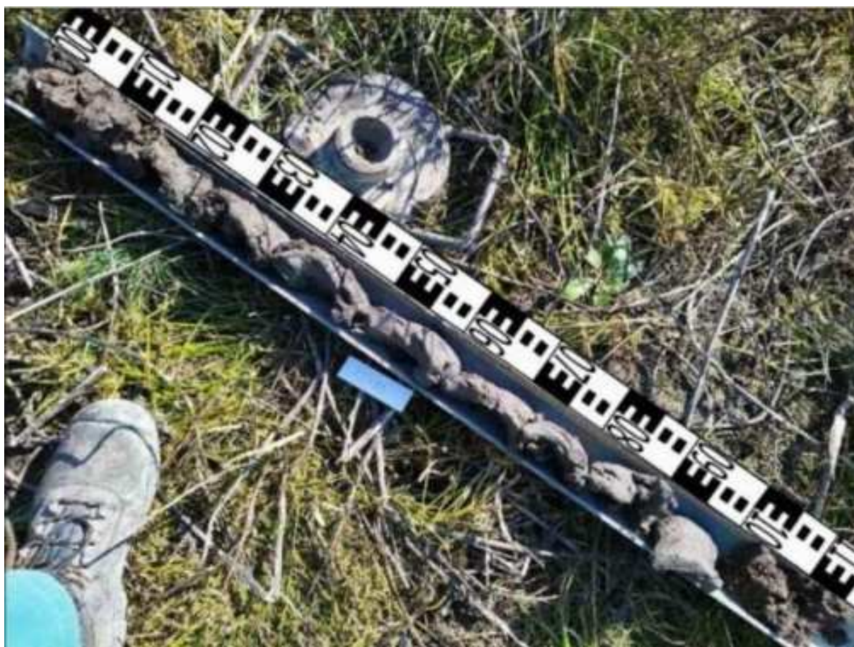
86. ábra: PT23 teljes furadékminta mércével