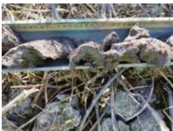
79. ábra: PT20 – 4. részlet