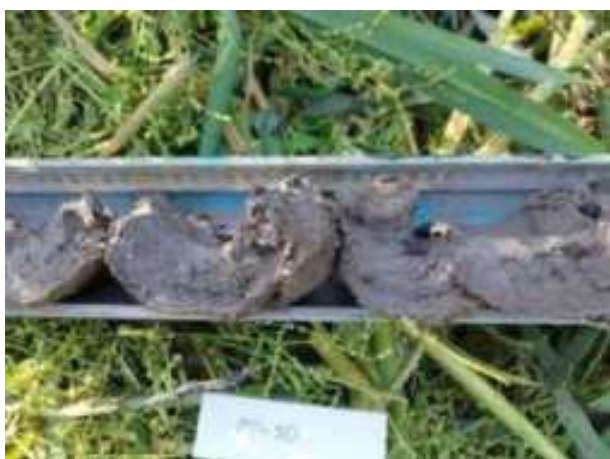
131. ábra: PT30 – 5. részlet