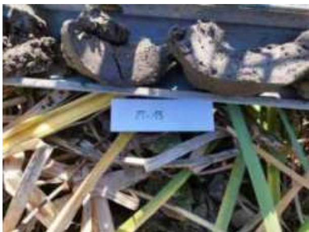
49. ábra: Mintavételi pont azonosító