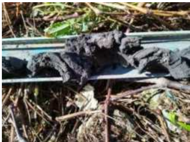
111. ábra: PT27 – 5. részlet