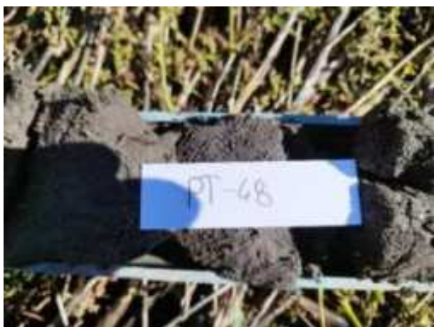
242. ábra: Mintavételi pont azonosító