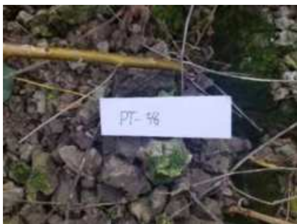
182. ábra: Mintavételi pont azonosító