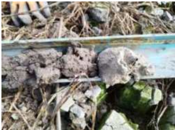
164. ábra: PT34 – 5. részlet