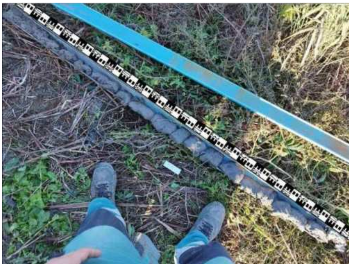
22. ábra: PT07 teljes furadékminta mércével