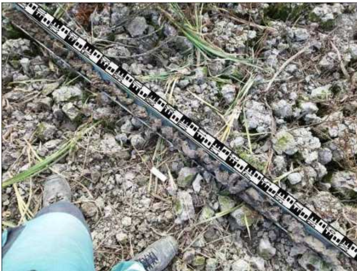
146. ábra: PT32 teljes furadékminta mércével