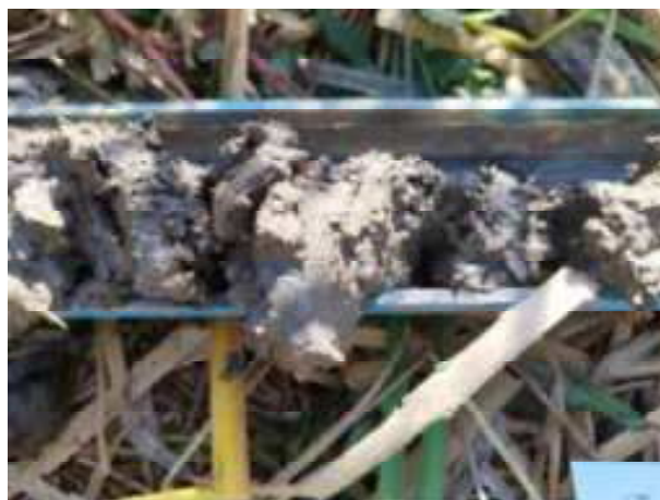
121. ábra: PT28 – 2. részlet