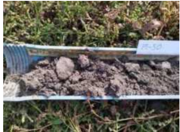
256. ábra: PT50 – 1. részlet