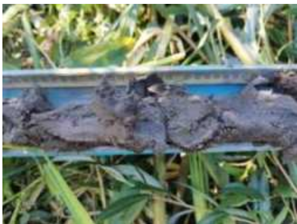
133. ábra: PT30 – 7. részlet