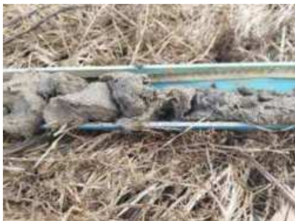
195. ábra: PT39 – 2. részlet