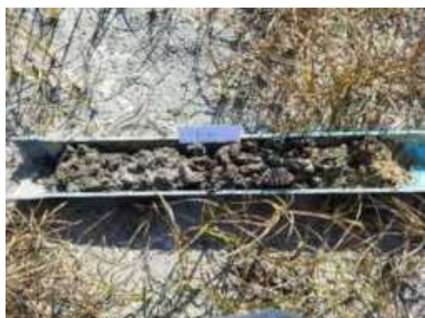
201. ábra: PT40 teljes furadékminta