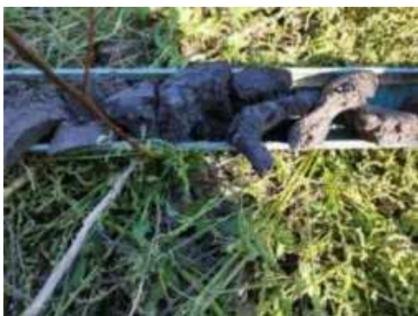
216. ábra: PT43 – 3. részlet