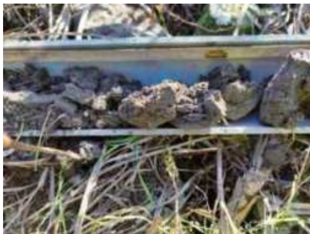
41. ábra: PT09 – 2. részlet