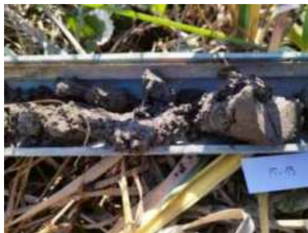
52. ábra: PT13 – 2. részlet