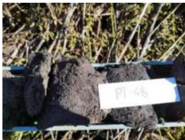
247. ábra: PT48 – 4. részlet