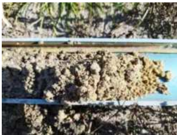
180. ábra: PT36 – 3. részlet