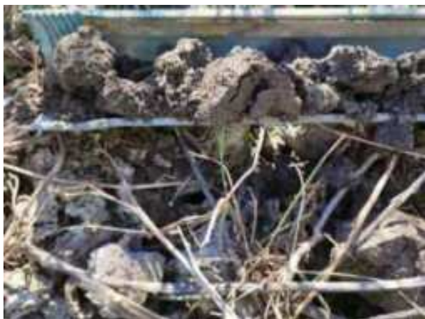
76. ábra: PT20 – 1. részlet