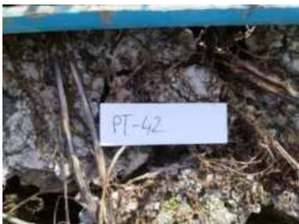
205. ábra: Mintavételi pont azonosító