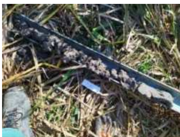
119. ábra: PT28 teljes furadékminta