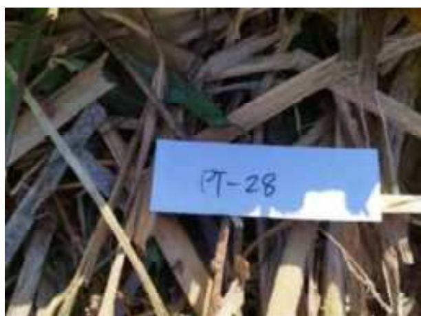
118. ábra: Mintavételi pont azonosító