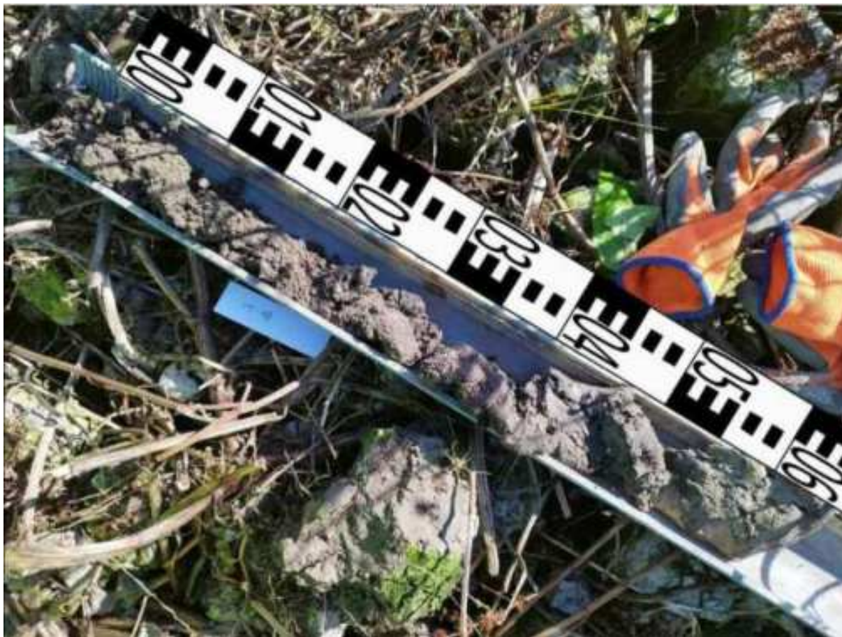
63. ábra: PT18 teljes furadékminta mércével