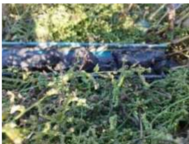
219. ábra: PT43 – 6. részlet