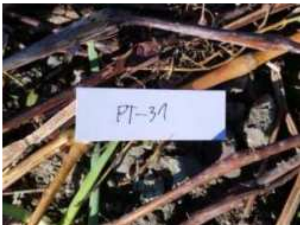
136. ábra: Mintavételi pont azonosító