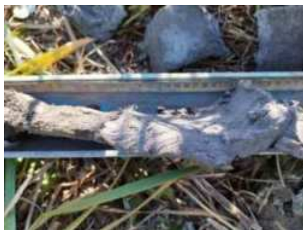
54. ábra: PT13 – 4. részlet