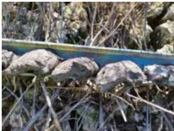
81. ábra: PT20 – 6. részlet