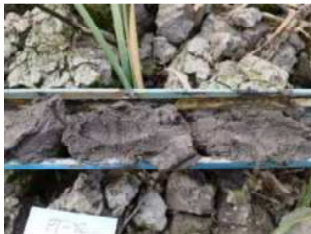
156. ábra: PT32 – 8. részlet