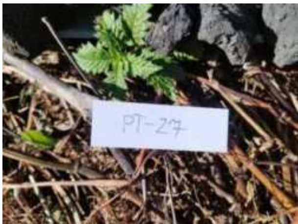
105. ábra: Mintavételi pont azonosító