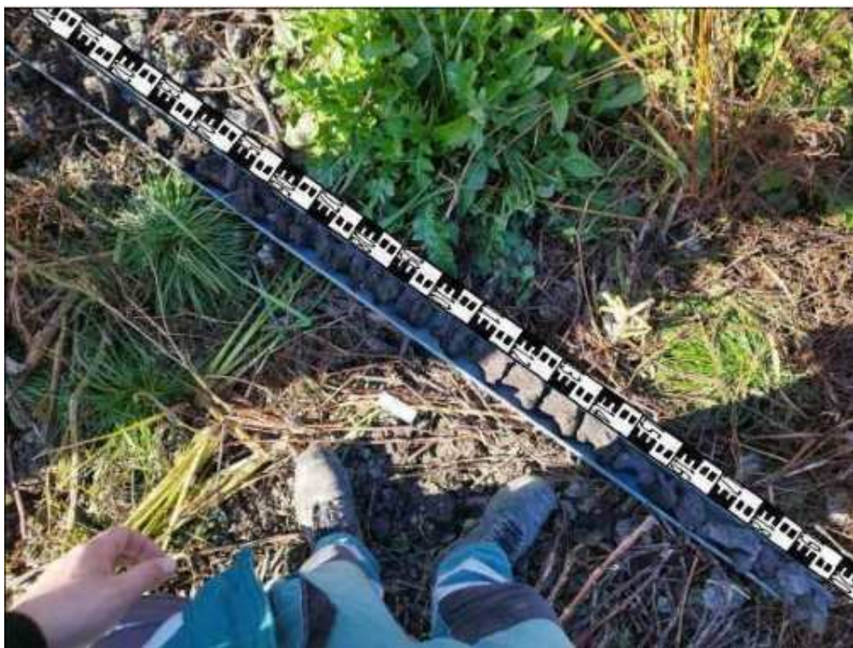
135. ábra: PT31 teljes furadékminta mércével