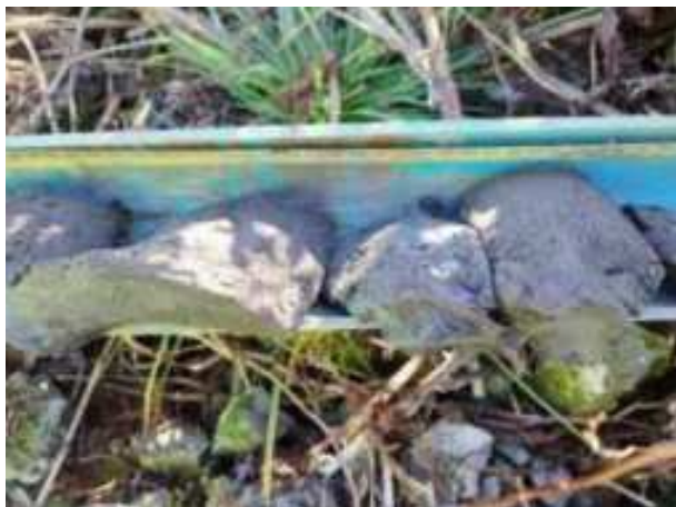
46. ábra: PT09 – 7. részlet