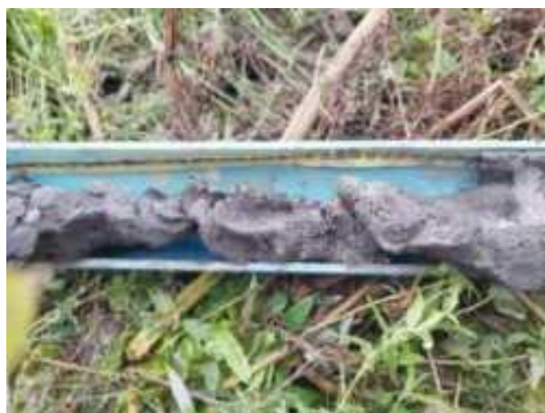
189. ábra: PT38 – 6. részlet