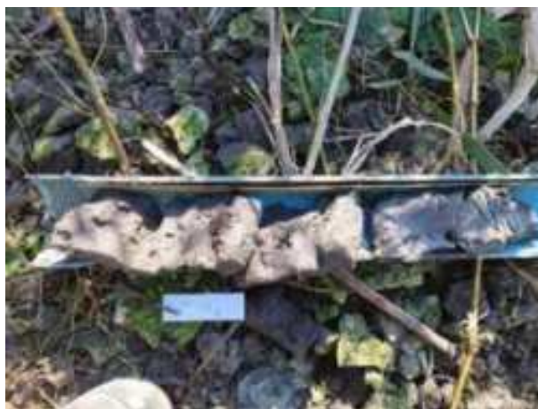
235. ábra: PT46 – 8. részlet