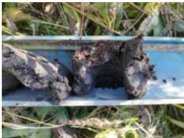
10. ábra: PT01 – 7. részlet