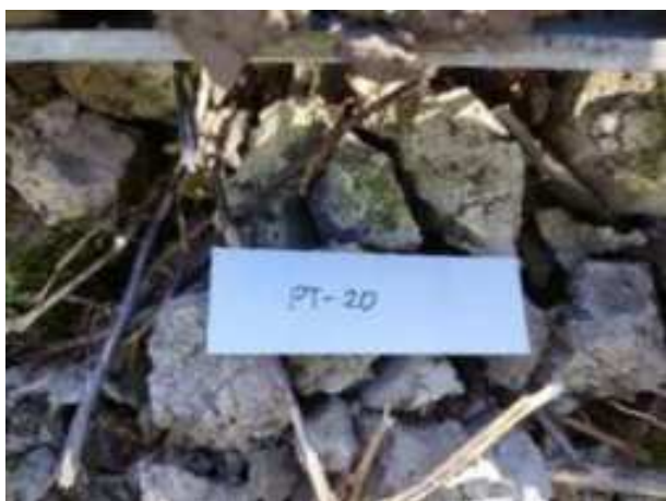
74. ábra: Mintavételi pont azonosító