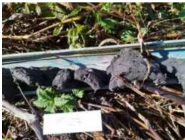
112. ábra: PT27 – 6. részlet