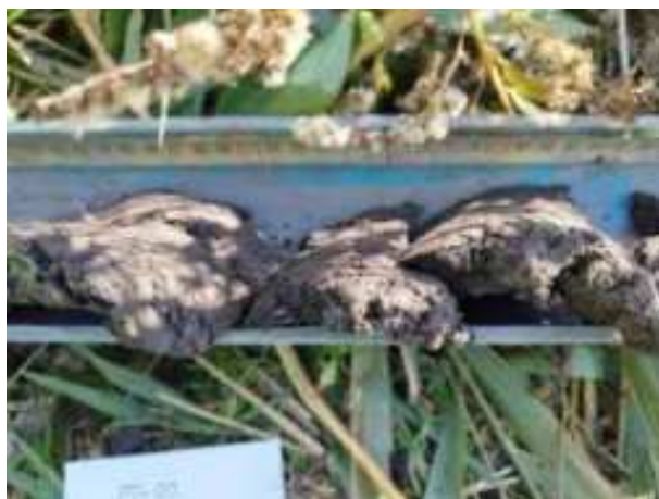
7. ábra: PT01 – 4. részlet