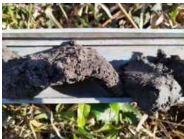
15. ábra: PT03 – 2. részlet