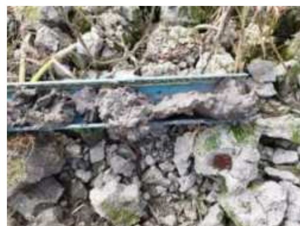
154. ábra: PT32 – 6. részlet