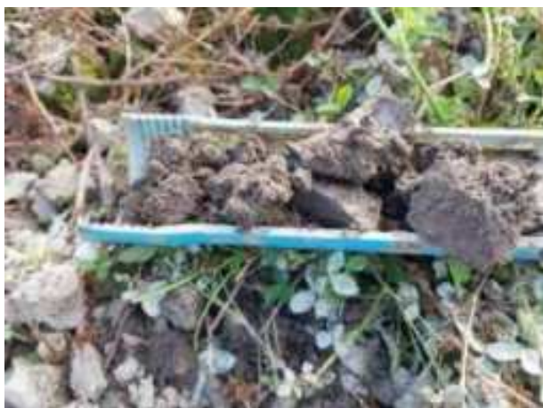
168. ábra: PT35 – 1. részlet