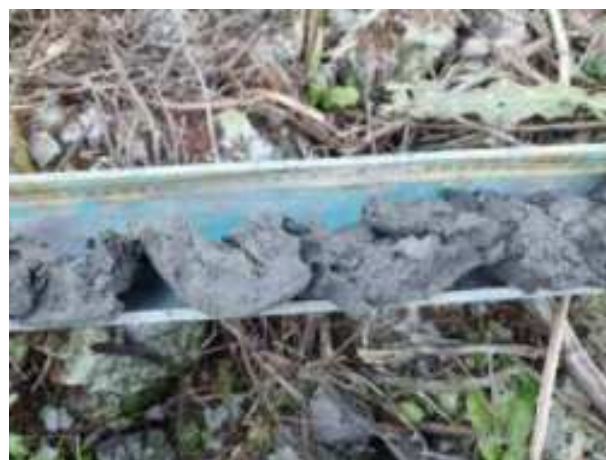
101. ábra: PT25 - 4. részlet