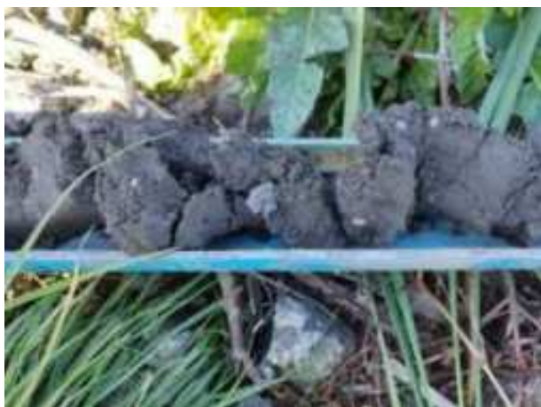
144. ábra: PT31 - 7. részlet