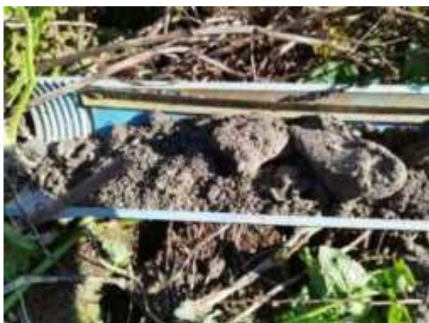
244. ábra: PT48 – 1. részlet