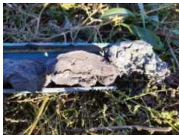
33. ábra: PT07 – 9. részlet