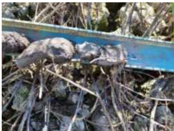
82. ábra: PT20 – 7. részlet