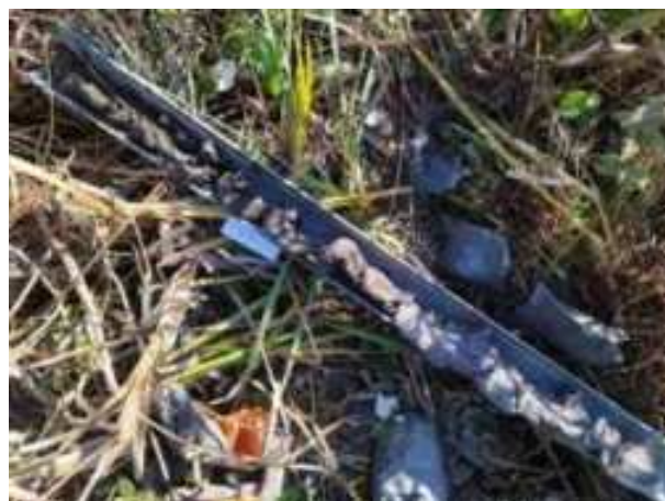
50. ábra: PT13 teljes furadékminta