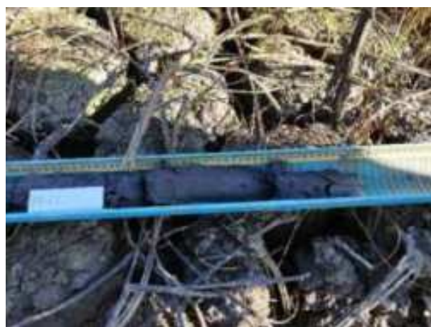
240. ábra: PT47 – 1. részlet