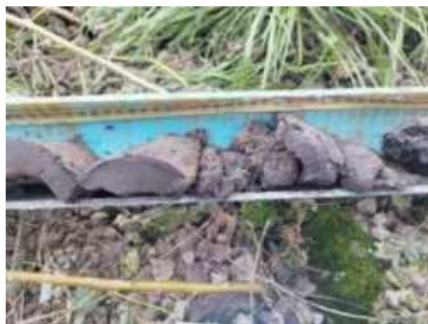
187. ábra: PT38 – 4. részlet