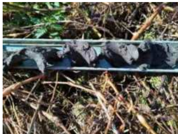
114. ábra: PT27 – 8. részlet