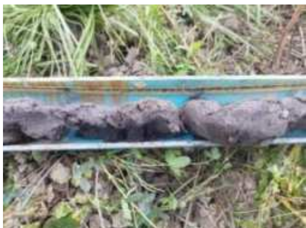
188. ábra: PT38 – 5. részlet