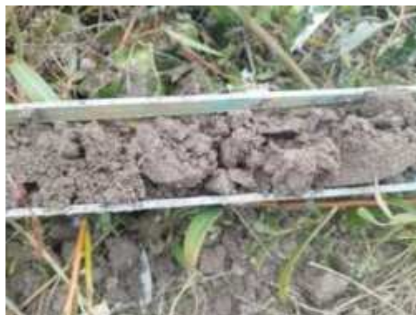
185. ábra: PT38 – 2. részlet