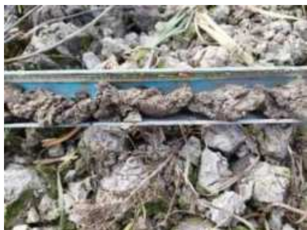
151. ábra: PT32 – 3. részlet