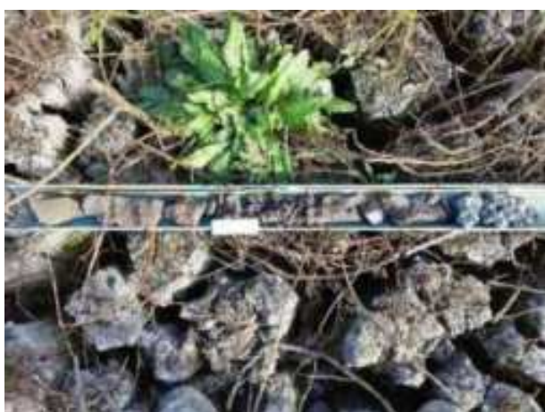
221. ábra: PT44 teljes furadékminta