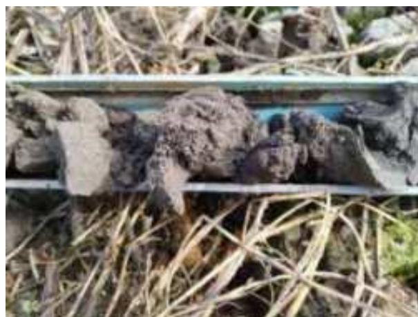
161. ábra: PT34 – 2. részlet