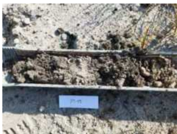
72. ábra: PT19 teljes furadékminta