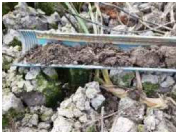
149. ábra: PT32 – 1. részlet