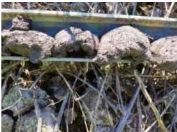
80. ábra: PT20 – 5. részlet