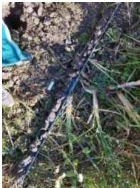
227. ábra: PT46 teljes furadékminta