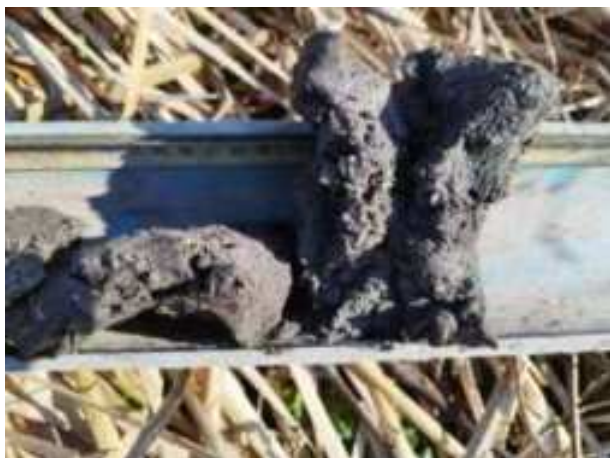
18. ábra: PT03 – 5. részlet