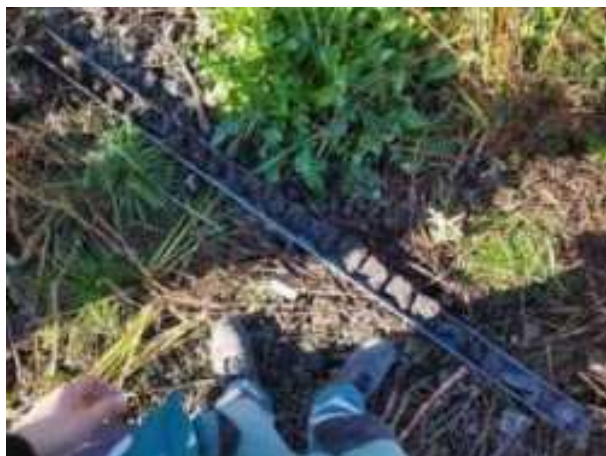
137. ábra: PT31 teljes furadékminta