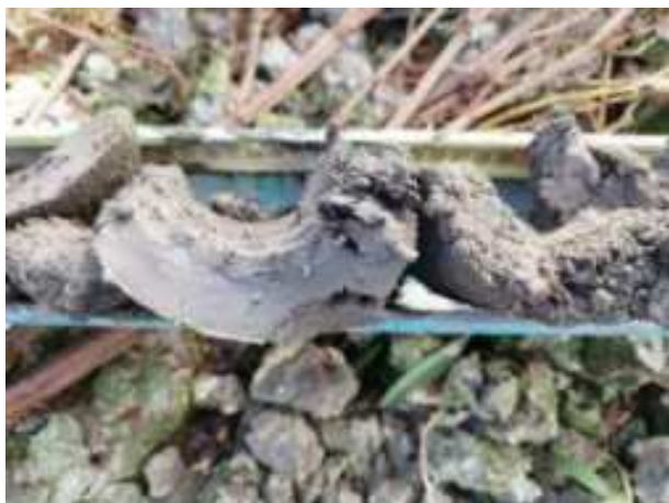
172. ábra: PT35 – 5. részlet