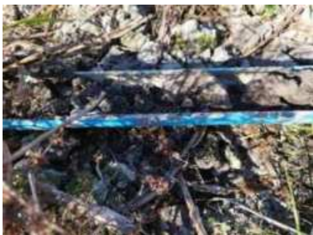
138. ábra: PT31 – 1. részlet