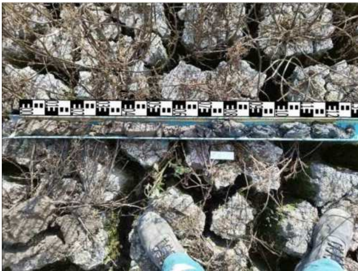
204. ábra: PT42 teljes furadékminta mércével