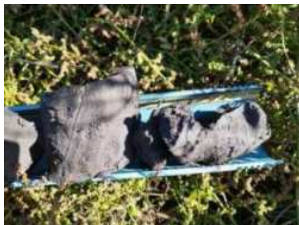
251. ábra: PT48 – 8. részlet