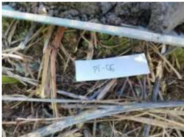
20. ábra: Mintavételi pont azonosító