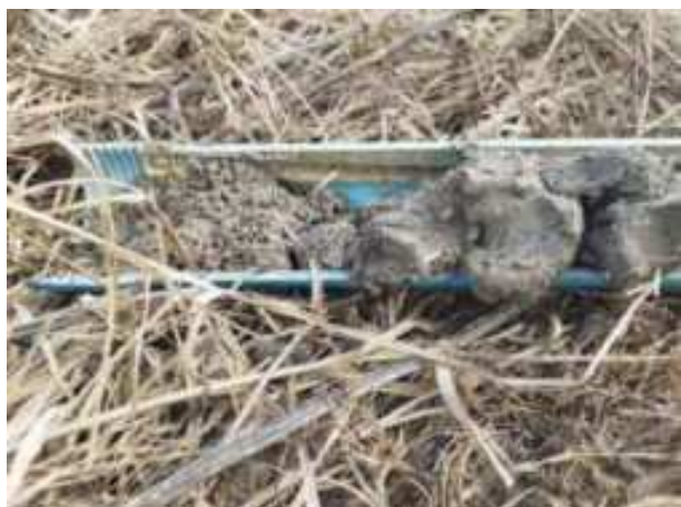
194. ábra: PT39 – 1. részlet