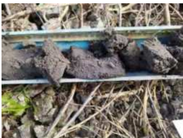
162. ábra: PT34 – 3. részlet