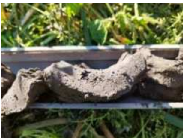
129. ábra: PT30 – 3. részlet