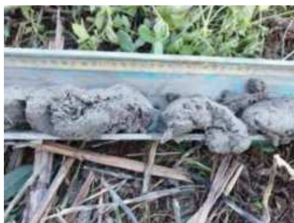
28. ábra: PT07 – 4. részlet