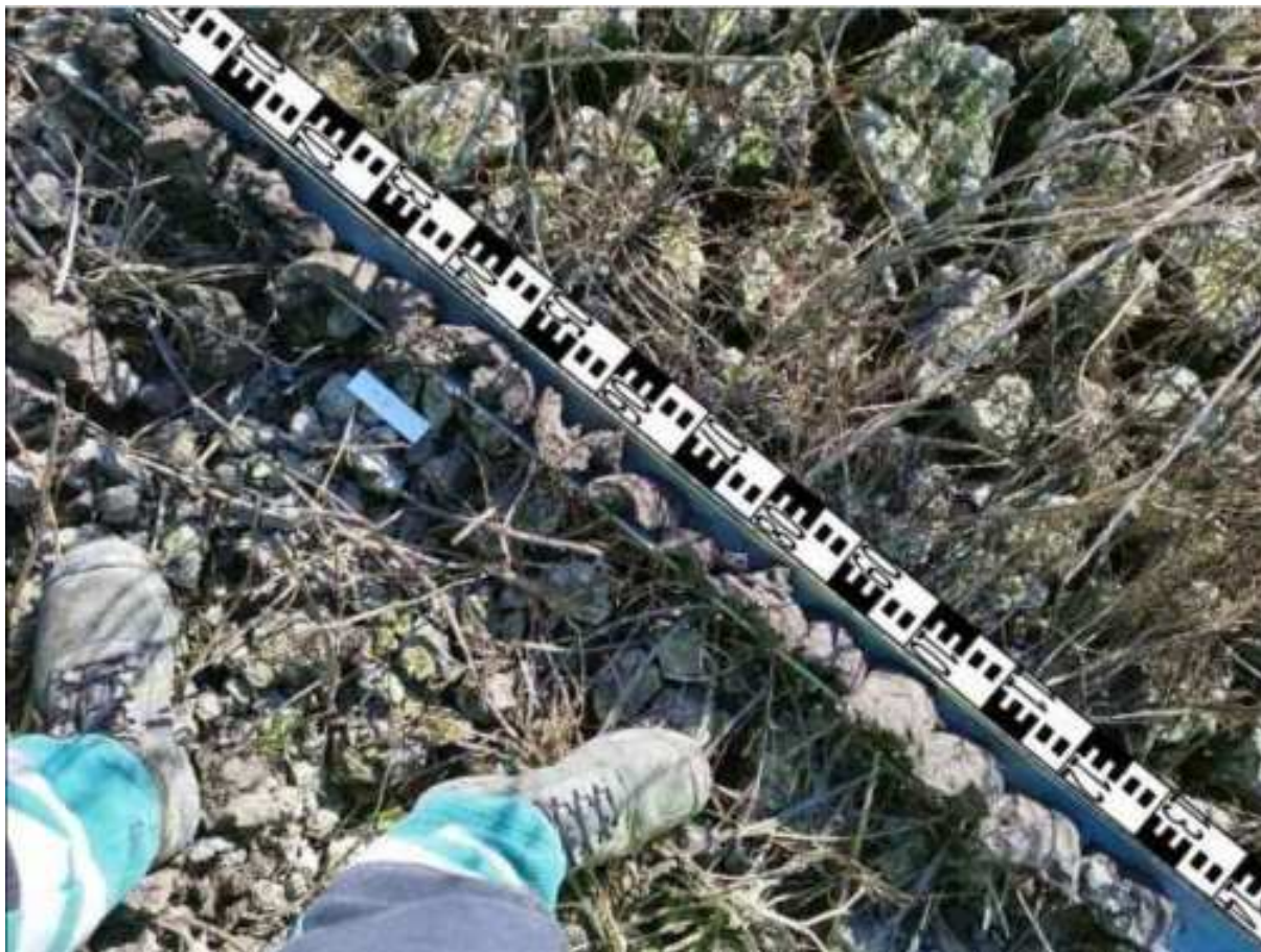
73. ábra: PT20 teljes furadékminta mércével