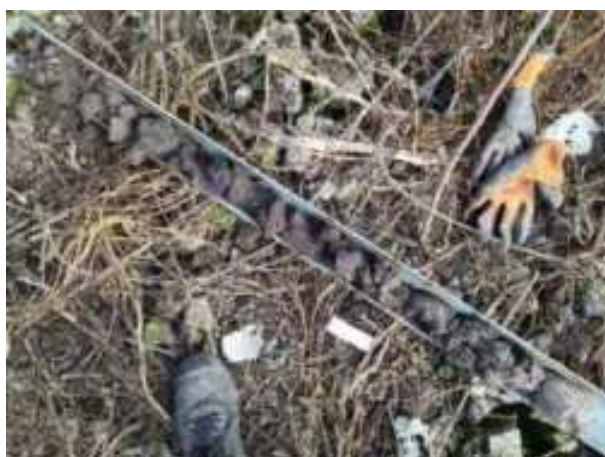
159. ábra: PT34 teljes furadékminta