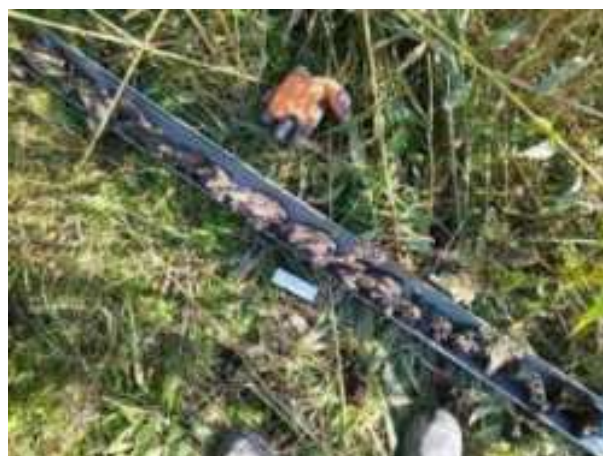
3. ábra: PT01 teljes furadékminta