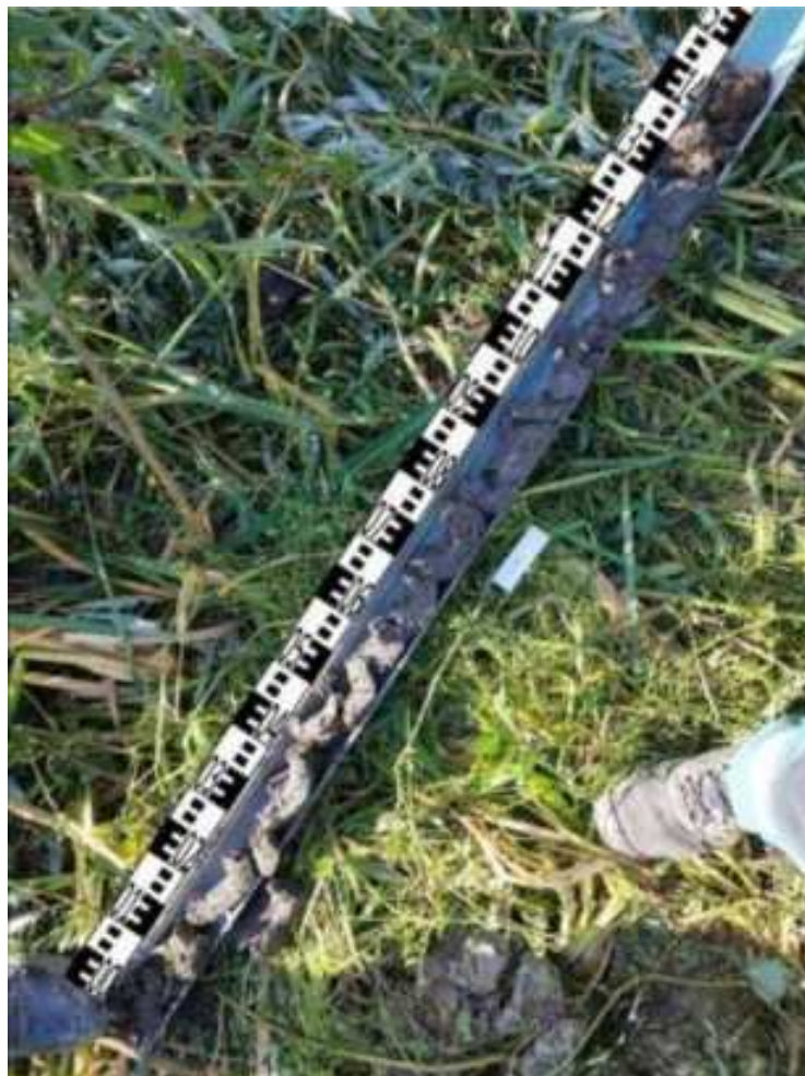
124. ábra: PT30 teljes furadékminta mércével