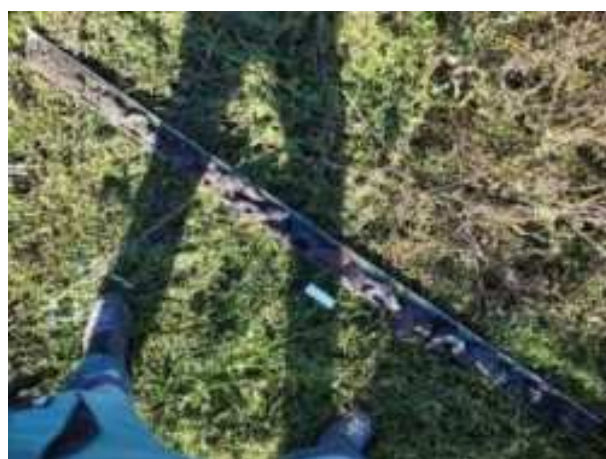
213. ábra: PT43 teljes furadékminta