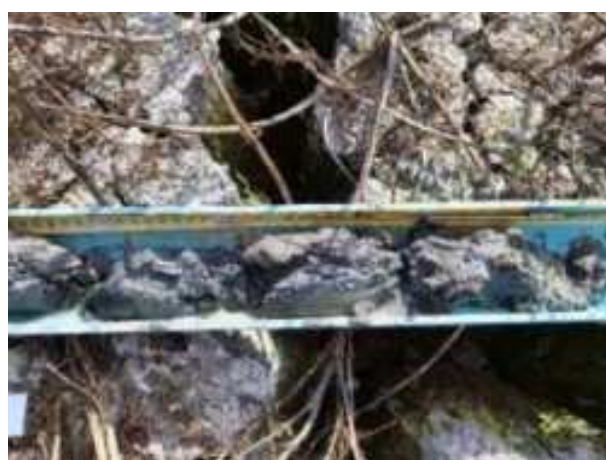
210. ábra: PT42 – 4. részlet