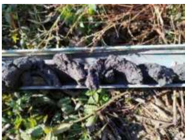
110. ábra: PT27 – 4. részlet