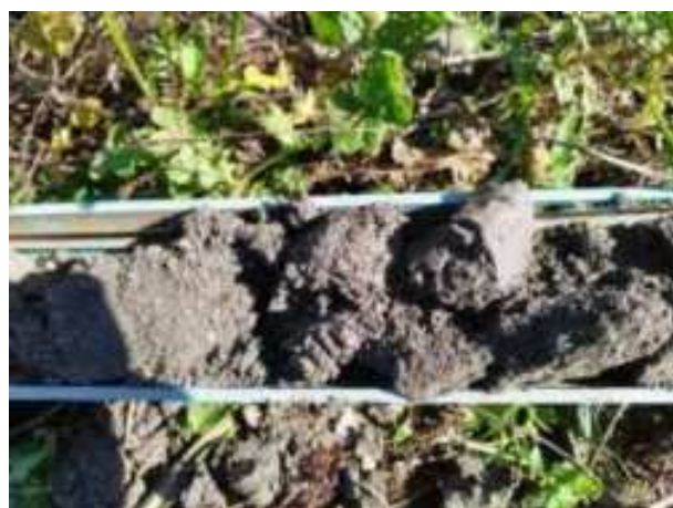
245. ábra: PT48 – 2. részlet