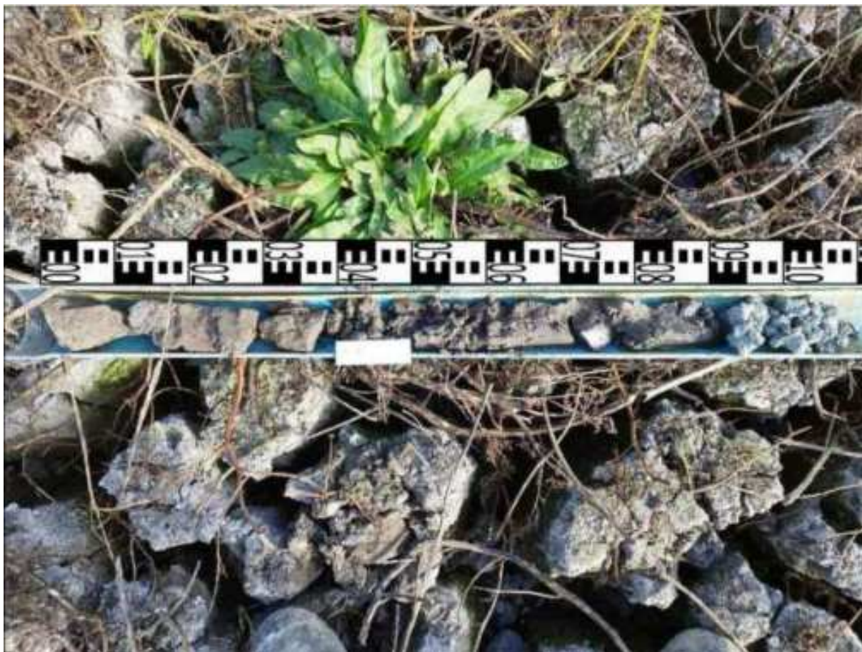
220. ábra: PT44 teljes furadékminta mércével