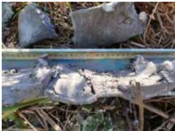
55. ábra: PT13 – 5. részlet