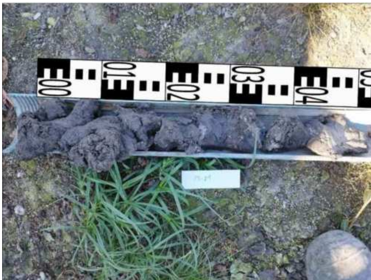
83. ábra: PT21 teljes furadékminta mércével