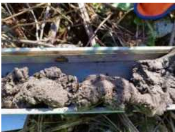
68. ábra: PT18 – 3. részlet