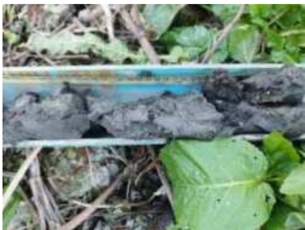
102. ábra: PT25 - 5. részlet