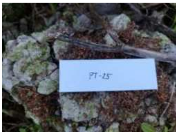
96. ábra: Mintavételi pont azonosító