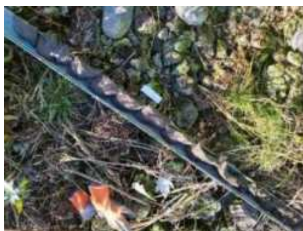
39. ábra: PT09 teljes furadékminta