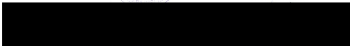
FŐMTERV Mérnöki Tervező Zrt. Meghatalmazott MÉRNOKI TERVEZŐ Zrt. 1024 Budapest, Lövház u. 37. 16.

CÍVIS KOMPLEX MÉRNÖK KFT. 4034 Debrecen Nagybánya u. 17. ⑥