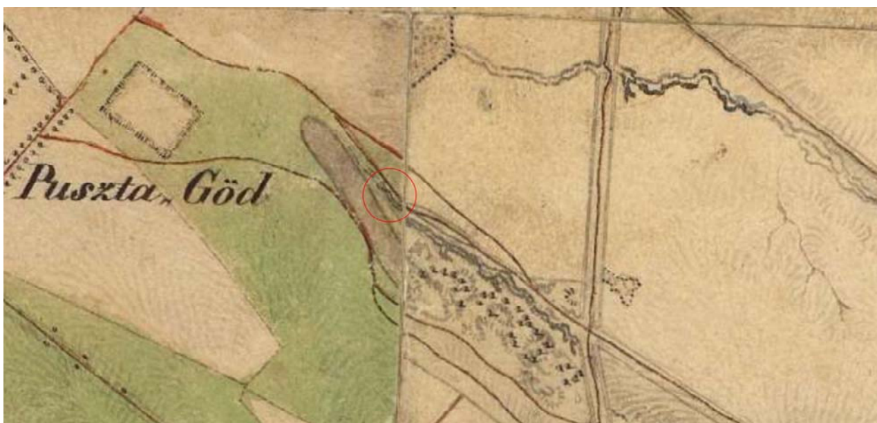
2. ábra Az ALTEO Circular Kft. hulladék gyűjtőhelyének helyzete a Magyar Királyság (1819-1869) Második katonai felmérés térképén, képernyőkivágot, a tárgyi terület elhelyezkedését piros körrel jelöltük