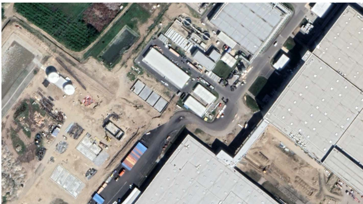
10. ábra Az ALTEO Circular Kft. hulladék gyűjtőhelyének helyzete a 2020. július 28-i légifelvételen képernyőkivágot