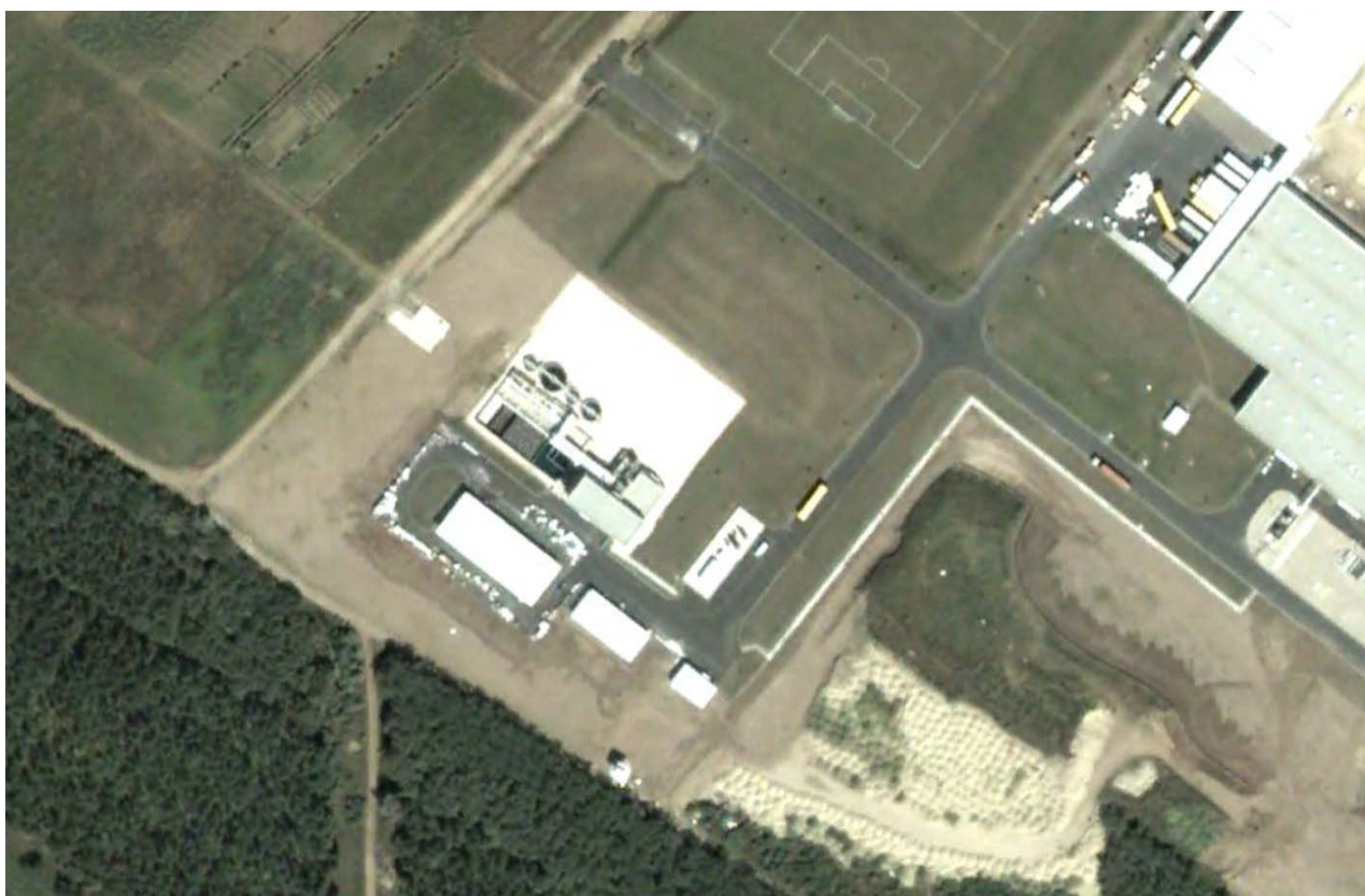
8. ábra Az ALTEO Circular Kft. hulladék gyűjtőhelyének helyzete a 2002. július 7-i légifelvételen képernyőkivágat