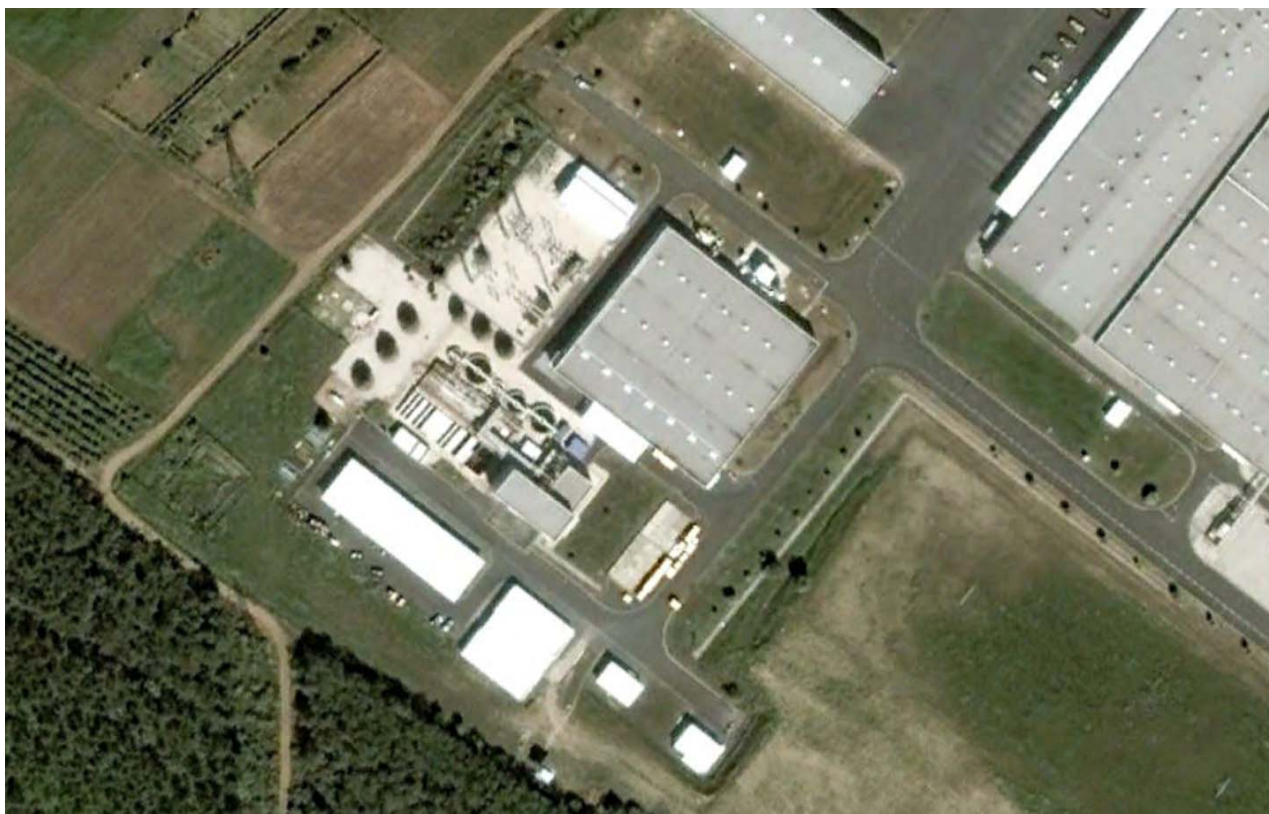
9. ábra Az ALTEO Circular Kft. hulladék gyűjtőhelyének helyzete a 2007. május 27-i légifelvételen képernyőkivágot