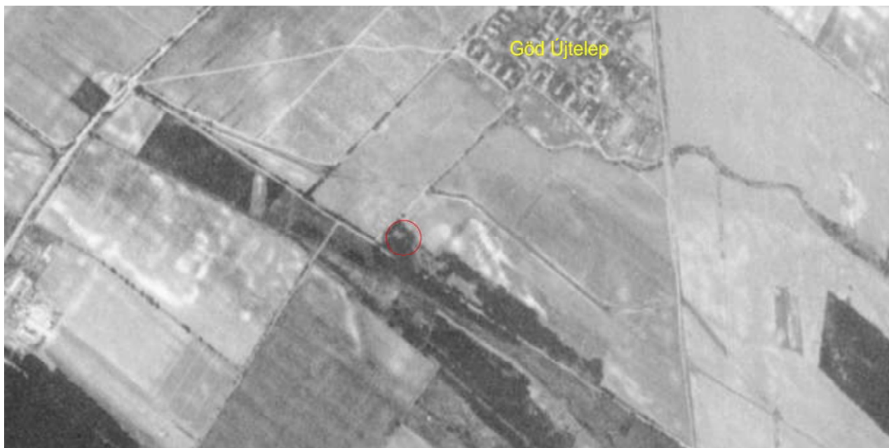
5. ábra Az ALTEO Circular Kft. hulladék gyűjtőhelyének helyzete az 1960-as években a Corona kéműhold által készített légifelvételen, képernyőkivágat, feliratozva, a tárgyi terület elhelyezkedését piros körrel jelöltük