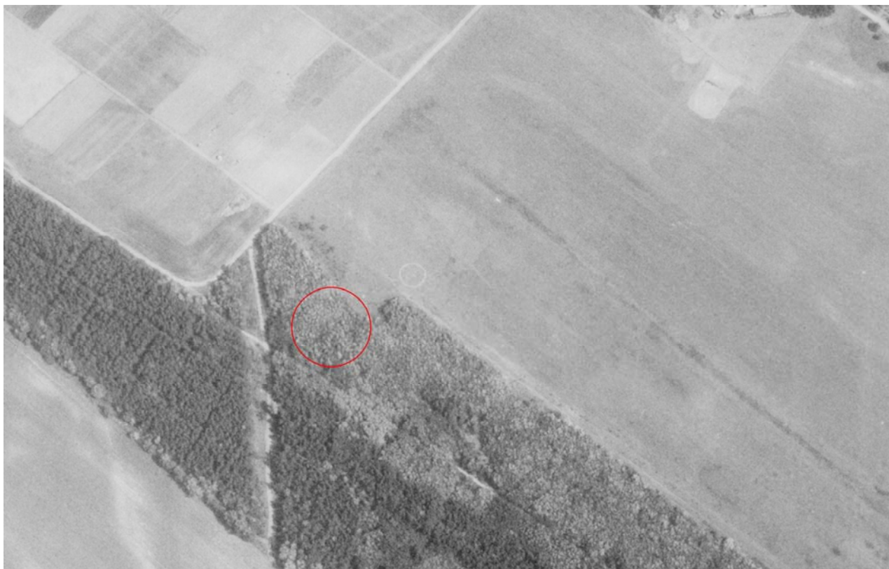
7. ábra Az ALTEO Circular Kft. hulladék gyűjtőhelyének helyzete a 2000. május 11-i légifelvételen képernyőkivágat, a tárgyi terület elhelyezkedését piros körrel jelöltük (forrás: 2000-0020-2658 számú légifelvétel)