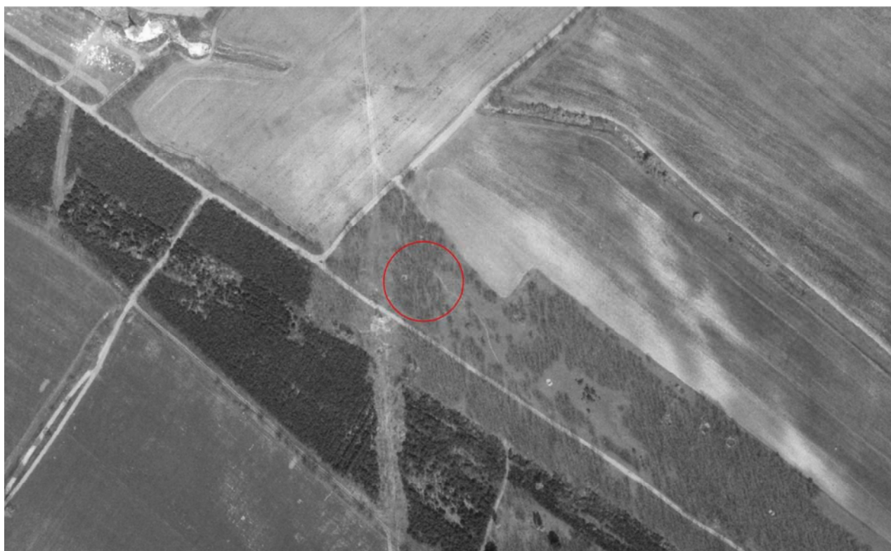
6. ábra Az ALTEO Circular Kft. hulladék gyűjtőhelyének helyzete az 1975. április 21-i légifelvételen képernyőkivágat, a tárgyi terület elhelyezkedését piros körrel jelöltük