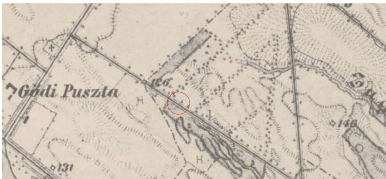
3. ábra Az ALTEO Circular Kft. hulladék gyűjtőhelyének helyzete a Habsburg Birodalom (1869-1887) Harmadik Katonai Felmérés térképén, képernyőkivágot, a tárgyi terület elhelyezkedését piros körrel jelöltük