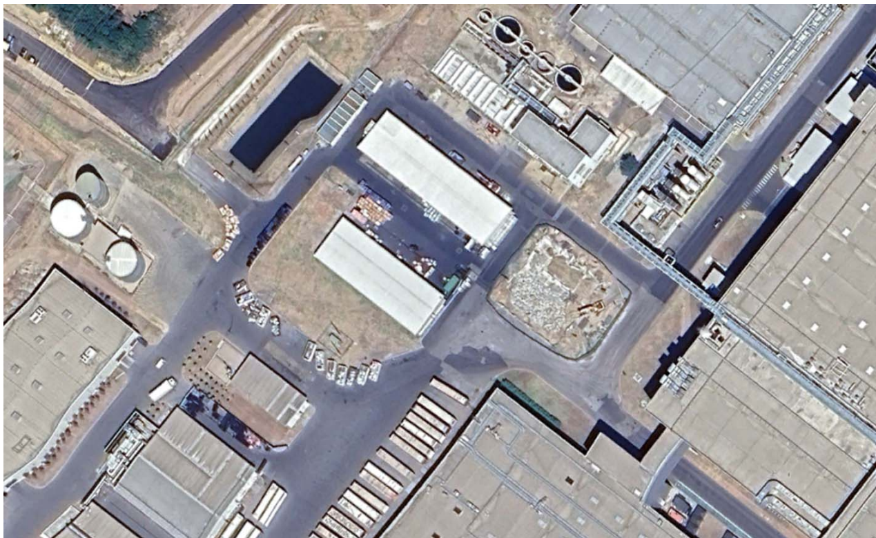
11. ábra Az ALTEO Circular Kft. hulladék gyűjtőhelyének helyzete a 2024. július 27-i légifelvételen képernyőkivágat